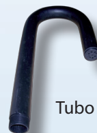
Tubo de aire