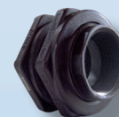
Conexión de Tanque