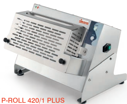
P-ROLL 420/1 PLUS