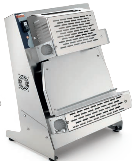
P-ROLL 420 RP