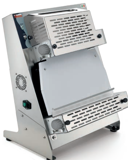
P-ROLL 420 RP PLUS