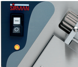
Comandi IP 54 per versioni standard Standard versions with IP 54 controls