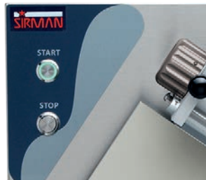
Comandi in acciaio inox IP 67 per versioni Plus Plus versions with IP 67 stainless steel controls