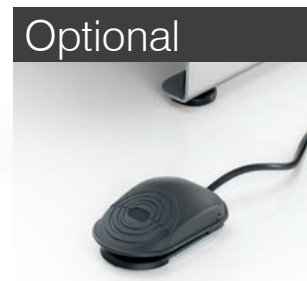
Pedaliera per versioni Plus Pedal controls for Plus versions