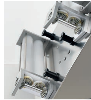
Sistema di trasmissione ad ingranaggi metallici Metal gears transmission