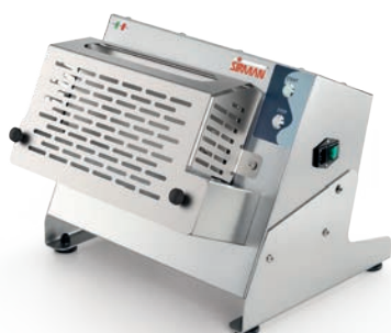
P-ROLL 320/1 PLUS

con pedaliera opzionale with optional pedal controls