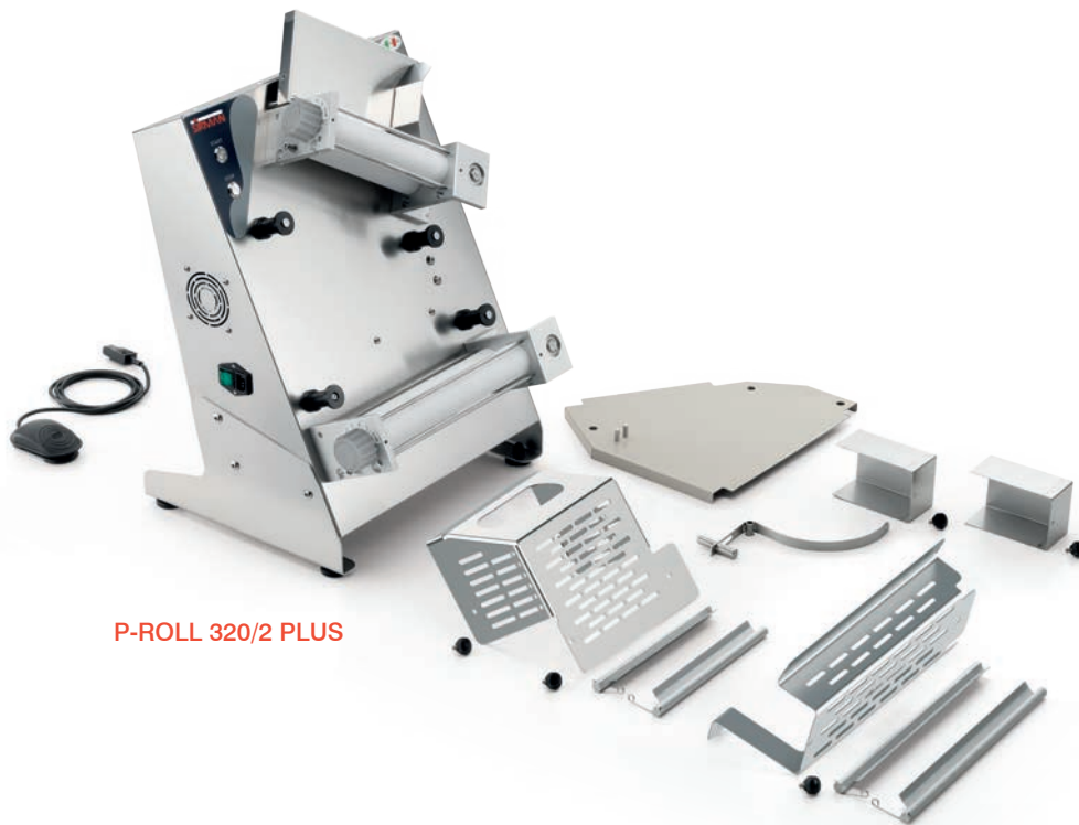
P-ROLL 320/2 PLUS