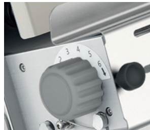
Manopole regolazione spessore rulli in plastica Adjustable thickness by plastic knobs