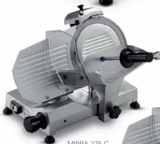
MIRRA 275 C