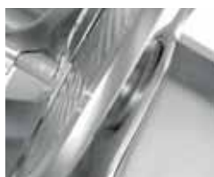
Protezione paracqua su puleggia Enclosed and sealed belt pulley