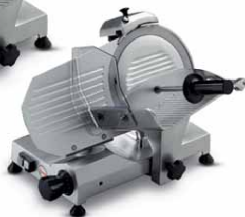
MIRRA 220 C