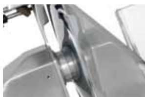
Ampio spazio per la pulizia Large space for cleaning