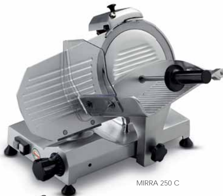
MIRRA 250 C