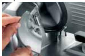
Parafetta tondo rimovibile su mod. 250 Removable round slicer deflector on mod. 250