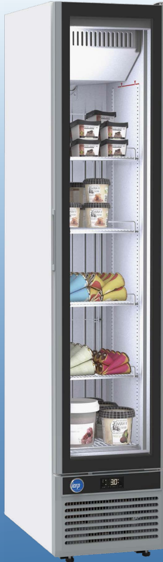
GLEE X SLIM NV