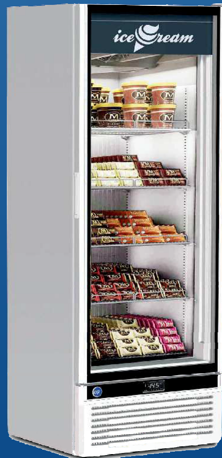
GLEE 55 LITE