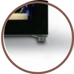
4 PIEDINI 4 ADJUSTABLE FEETS