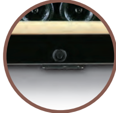
CHIUSURA A CHIAVE LOCKING SYSTEM