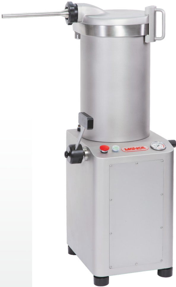
FC-20 / FC-25 / FC-30