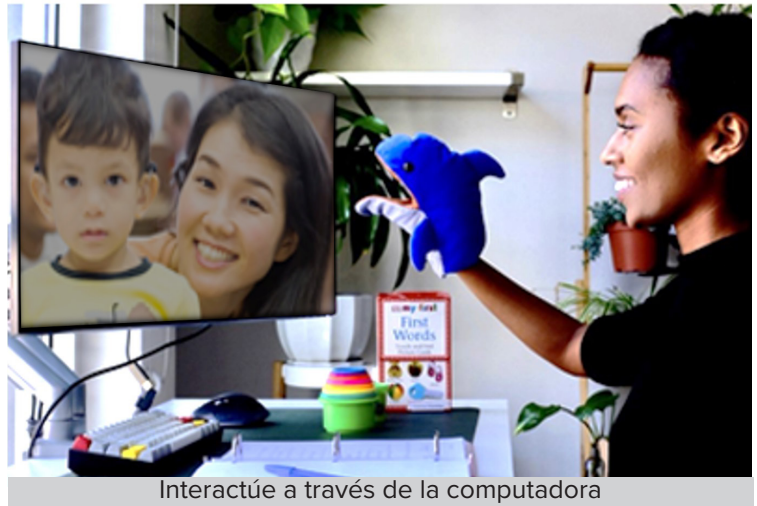
Interactúe a través de la computadora

Aprenda sin salir de casa con los expertos de JTC, en videoconferencias en español, para que los padres adquieran seguridad para utilizar TAV