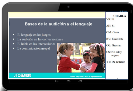
Véalo en la tableta