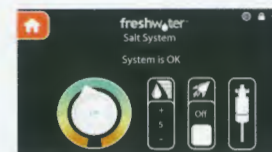
Affichage d'écran tactile