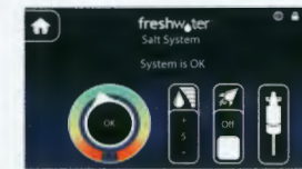
Affichage d'écran tactile