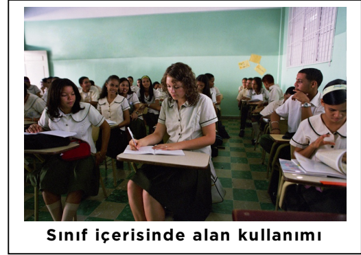
Sınıf içerisinde alan kullanımı

Kişisel alan bir kişinin rahat hissedebilmesi için diğerleri ile arasında koruduğu mesafedir. Hall, kişisel alanı bir insanların her zaman ve her yere kendileriyle birlikte taşıdığı bir baloncuk olarak tanımlamıştır . Bu baloncuk duruma ve kişinin kiminle etkileşimde olduğuna göre boyut değiştirir (örn. yakın arkadaşlar yabancılara göre daha yakındır) ve bu alan kültüre göre de değişim gösterir.