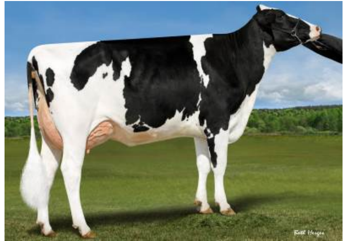
Madre: Genosource Bravo 47586-ET VG-86

Bisablo: Mr Spring Nightcap 74636-ET TC TD TE TL TV TY Bisabla: Ms Brody Jospr 32051-ET