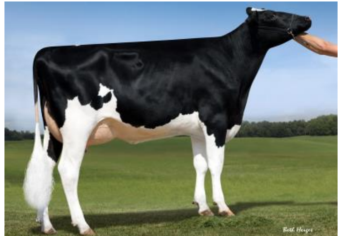
Bisabla: Ms Brody Jospr 32051-ET