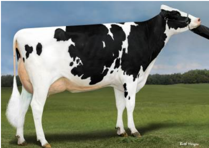
Abuela: Genosource Brazen 40218-ET