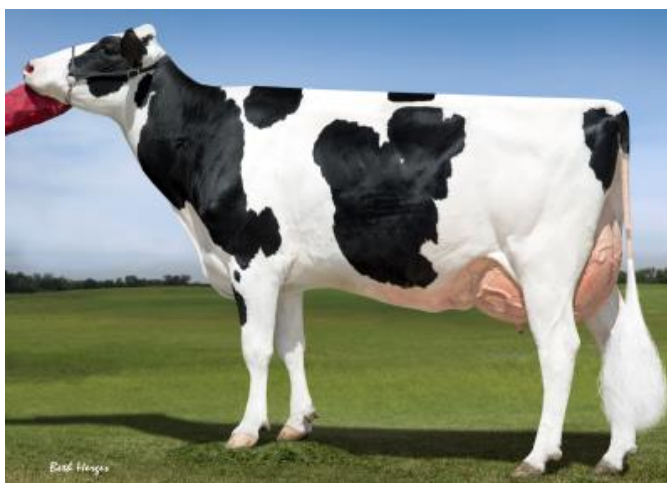
Bisabla: Sandy-Valley Robust Ruby-ET

Padre: Genosource Captain-ET TC TD TE TL TR TV TY Madre: Genosource High Roller-ET G-77 02-04 3x 305d 28760m 3.9 1134f 3.5 1018p Abuelo: Mr Detour High Noon-ET TC TD TE TL TR TV TY Abuela: Genosource Ruby 33870-ET 02-03 3x 365d 31140m 4.1 1262f 3.0 940p Bisabla: Mr Mogul Delta 1427-ET TC TD TL TR TV TY Bisabla: Sandy-Valley Robust Ruby-ET EX-90 06-00 3x 336d 37140m 3.4 1248f 3.2 1181p