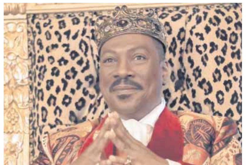
EDDIE MURPHY REGRESA A UNO DE SUS PAPELES EMBLEMÁTICOS: AKEEM