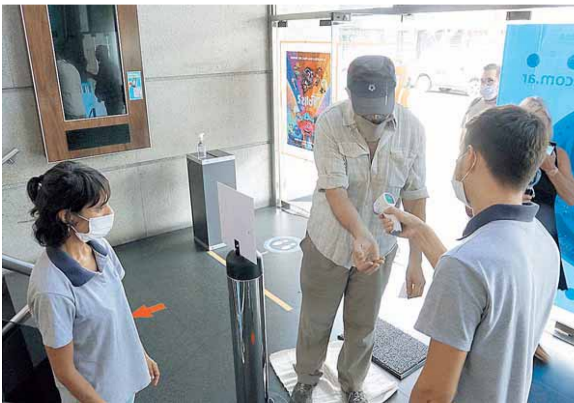
FILAS CON DISTANCIA Y LA "PISTOLITA" TOMANDO LA FIEBRE: POSTALES DE LA NUEVA NORMALIDAD / SEBASTIÁN CASALI