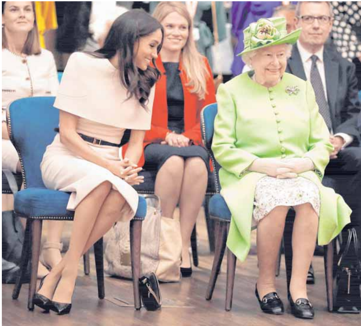
MEGHAN MARKLE Y LA REINA ISABEL II, CADA VEZ MÁS LEJOS, Y CON ESCÁNDALO, PARA LA CORONA BRITÁNICA

UNA CRISIS PÚBLICA NUNCA VISTA DESDE LA ÉPOCA DE LADY DI