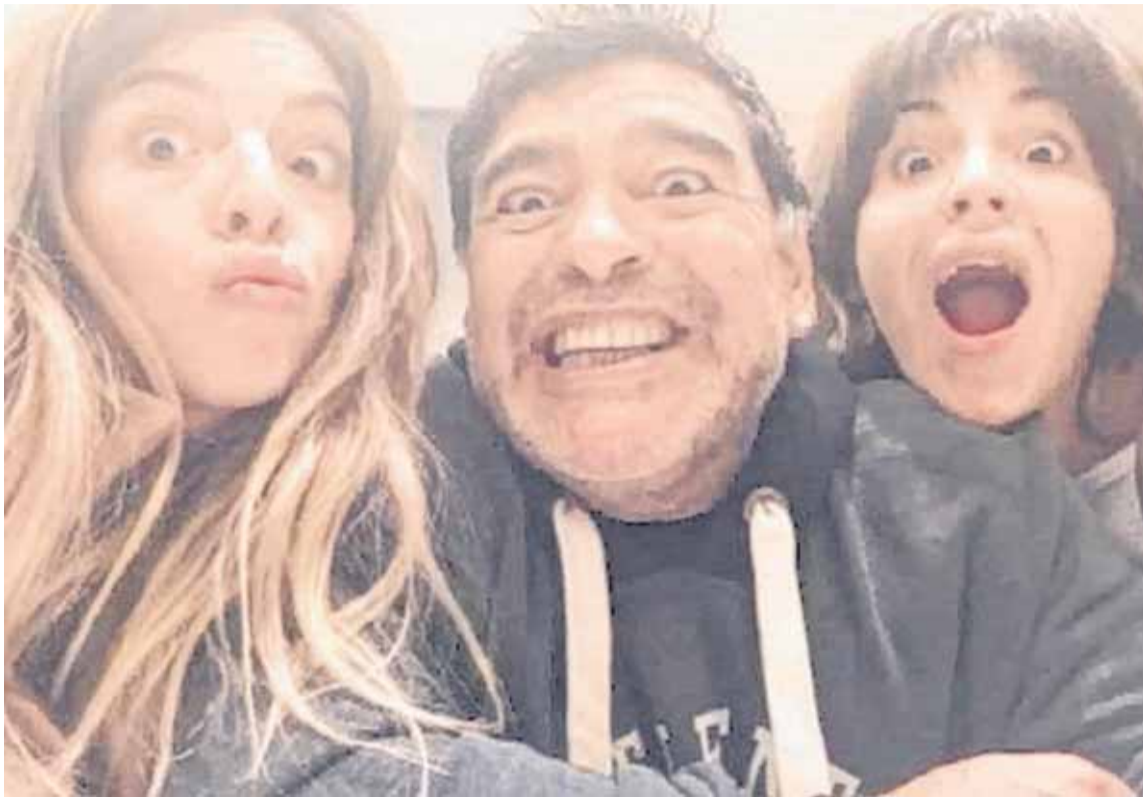
DALMA, DIEGO Y GIANINNA, EN OTROS TIEMPOS, MÁS FELICES