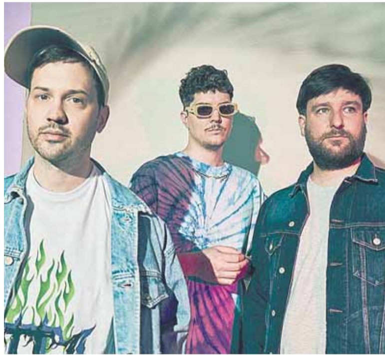
RAYOS LASER PRESENTA “EL REFLEJO” MAÑANA A LAS 20 EN LA CIUDAD