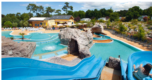
Espace Aquatique Camping Les Pins, Erquy

L'Hébergement des stagiaires se fera sous tentes.