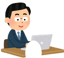
つか 使います【Ⅰ】* to use