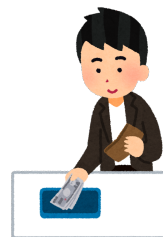
はら 払います【Ⅰ】* to pay