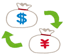
か 換えます【Ⅱ】* to change