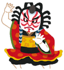
かぶき 歌舞伎* Kabuki theatre