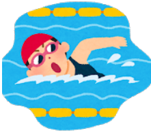
およ 泳ぎます【Ⅰ】* to swim