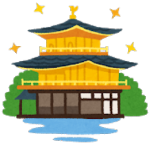
きんかくじ 金閣寺* Kinkakuji