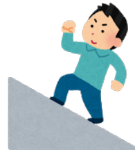
のぼ 登ります【Ⅰ】* to climb