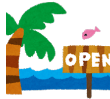
うみ 海* sea