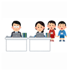
けんがく 見学します【Ⅲ】* to study by observation, to go on a field trip