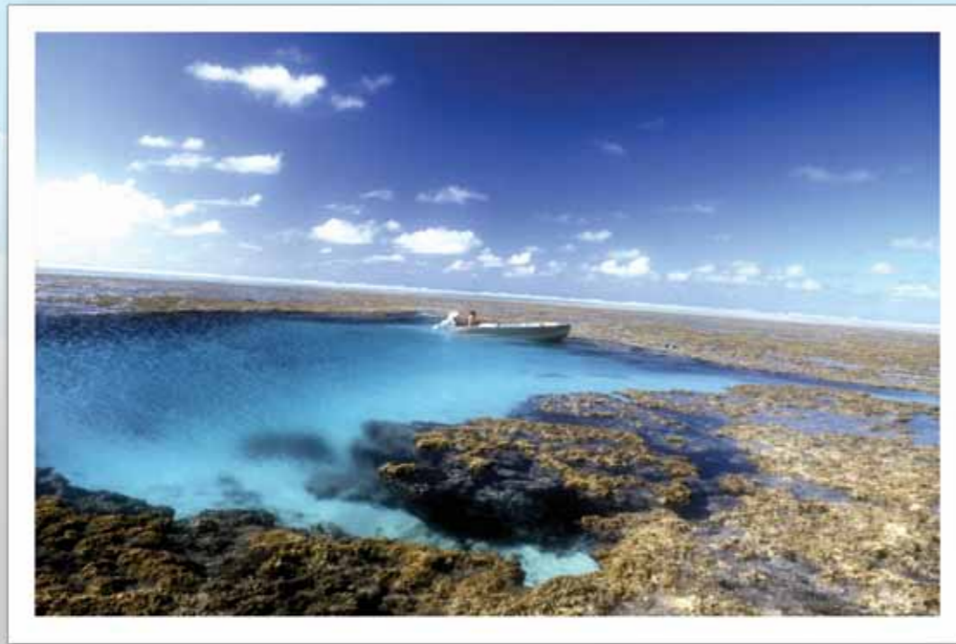
Recifes – Atol das Rocas.