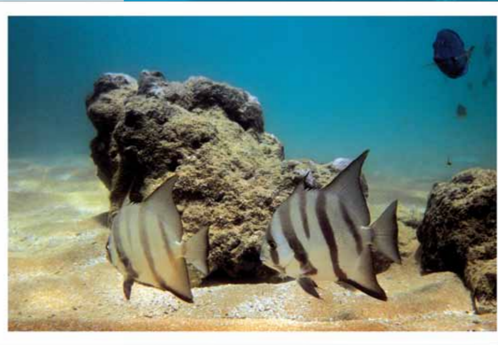
Área de Proteção Ambiental Costa dos Corais, PE e AL.