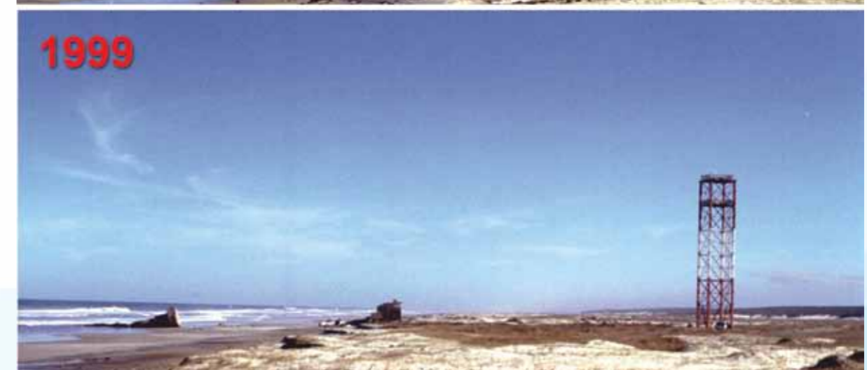
Exemplo de processo erosivo ao longo do tempo. Farol da Conceição, litoral sul do Rio Grande do Sul.