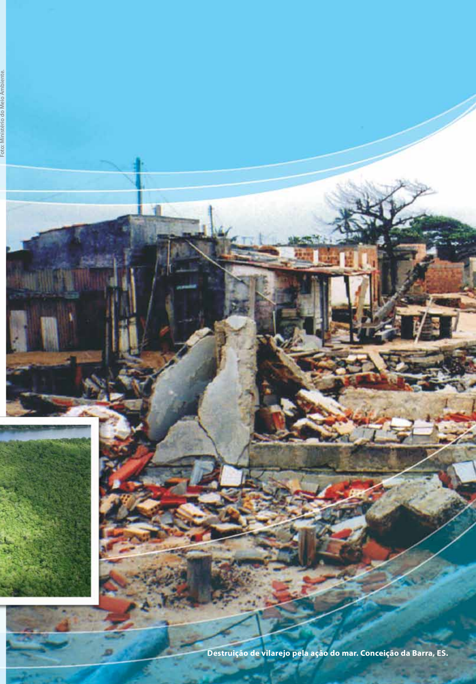
Destruição de vilarejo pela ação do mar. Conceição da Barra, ES.