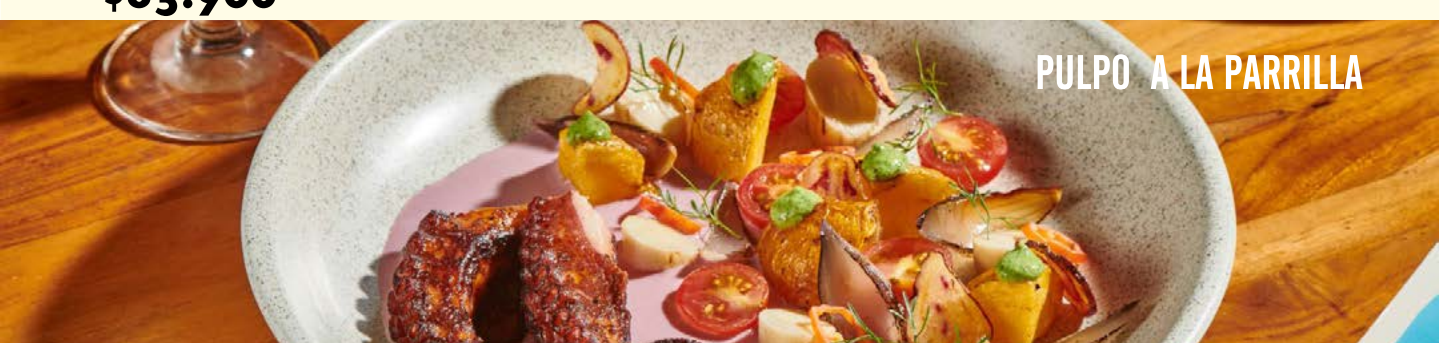
PULPO A LA PARRILLA