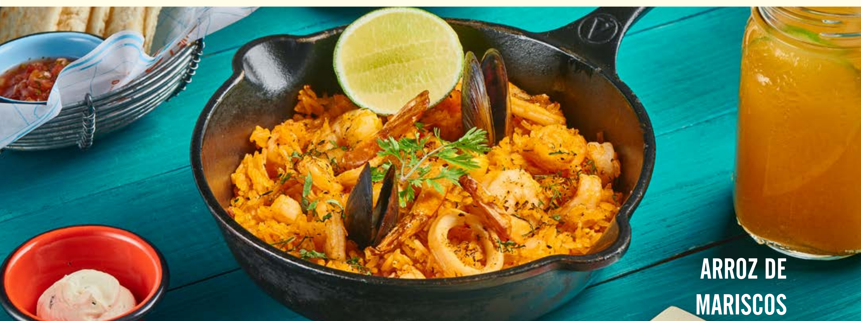
ARROZ DE MARISCOS