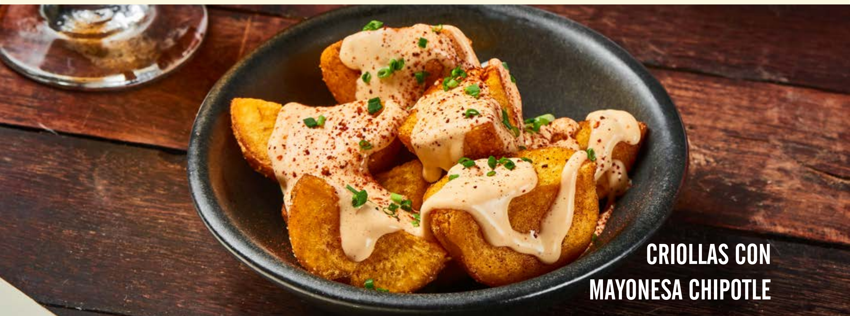
CRIOLLAS CON MAYONESA CHIPOTLE