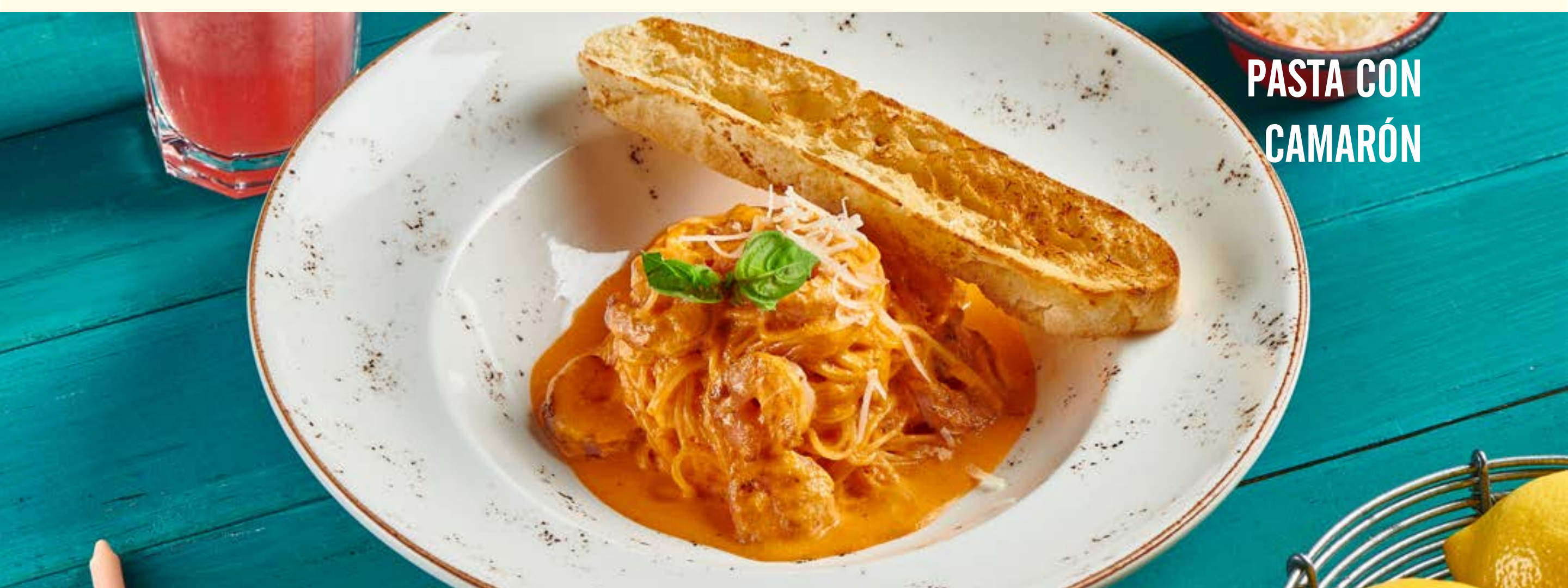
PASTA CON CAMARÓN