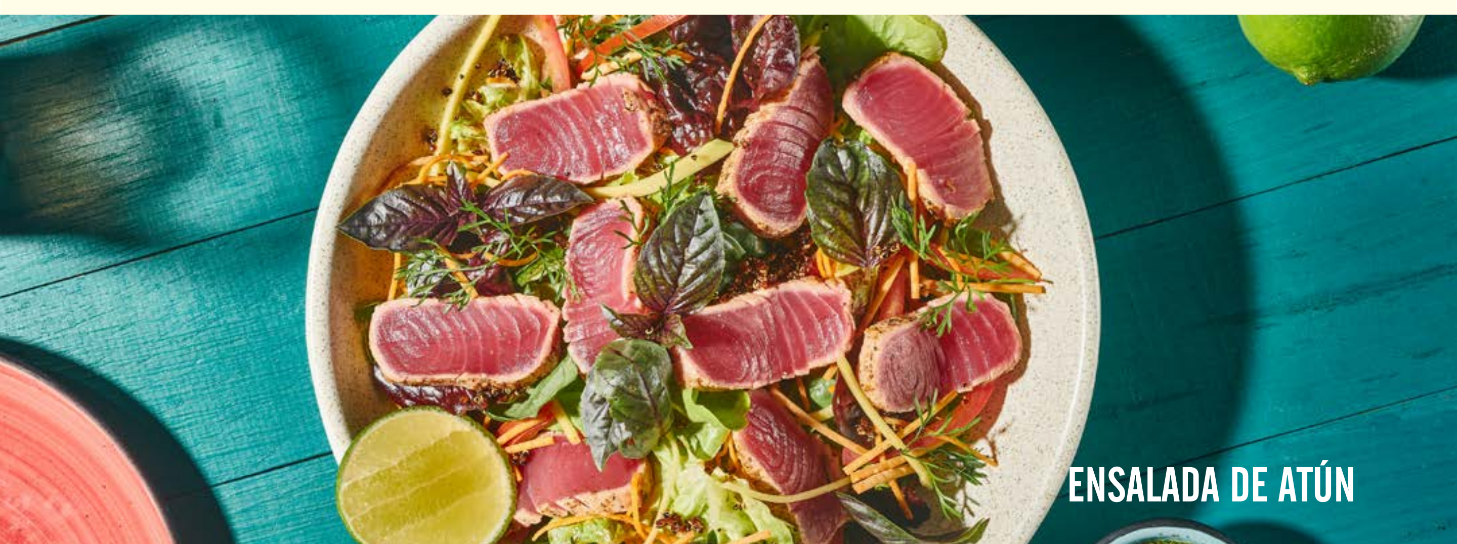
ENSALADA DE ATÚN

*También disponible en versión vegetariana.