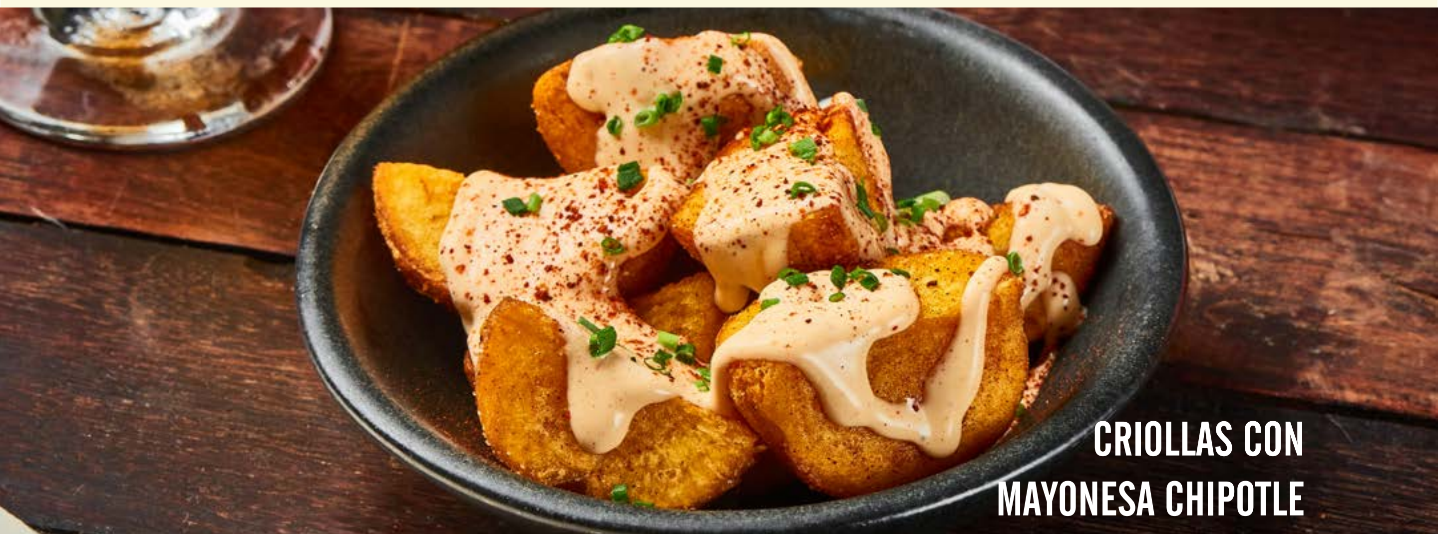
CRIOLLAS CON MAYONESA CHIPOTLE