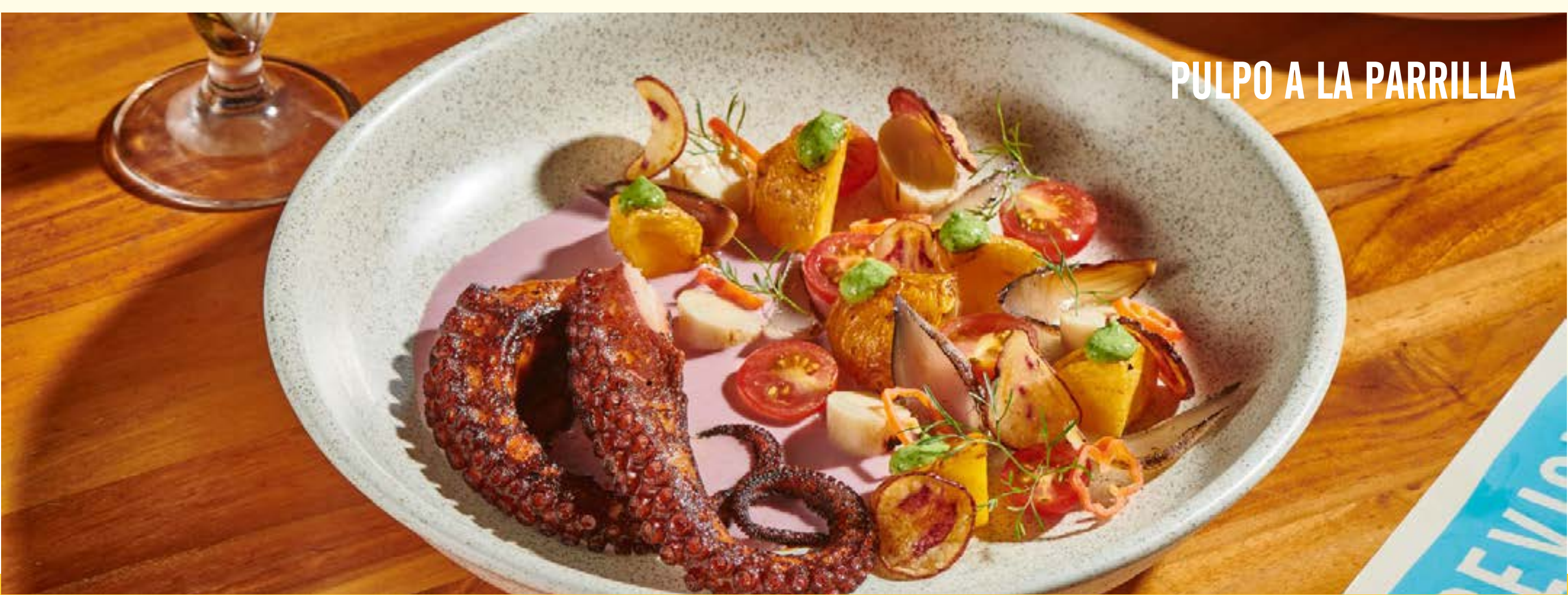
PULPO A LA PARRILLA