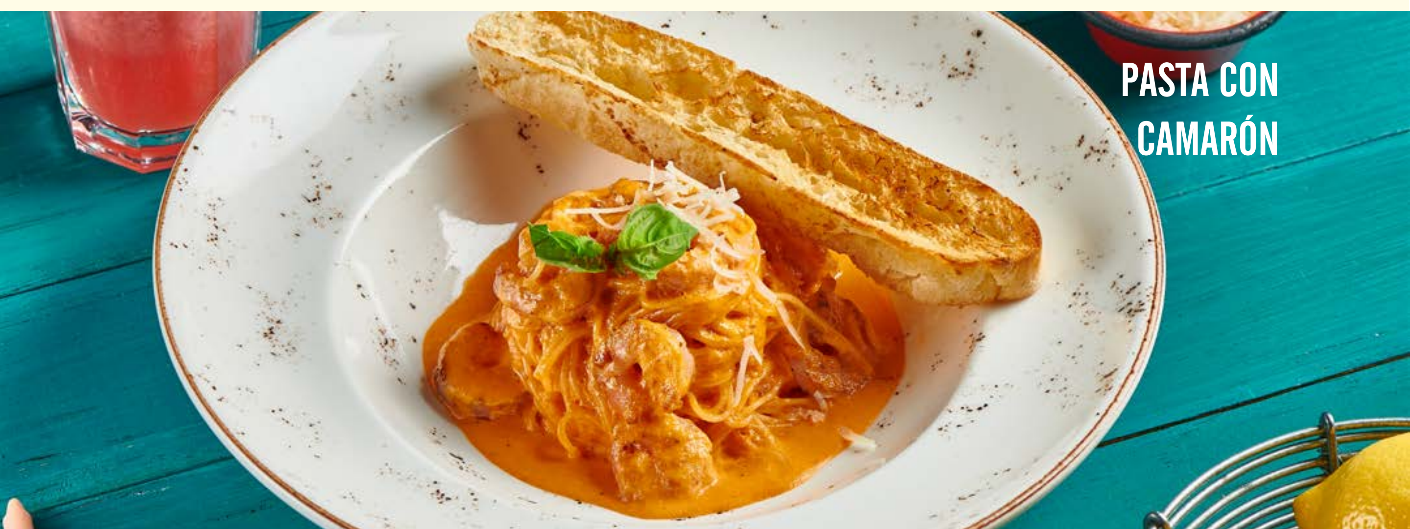
PASTA CON CAMARÓN