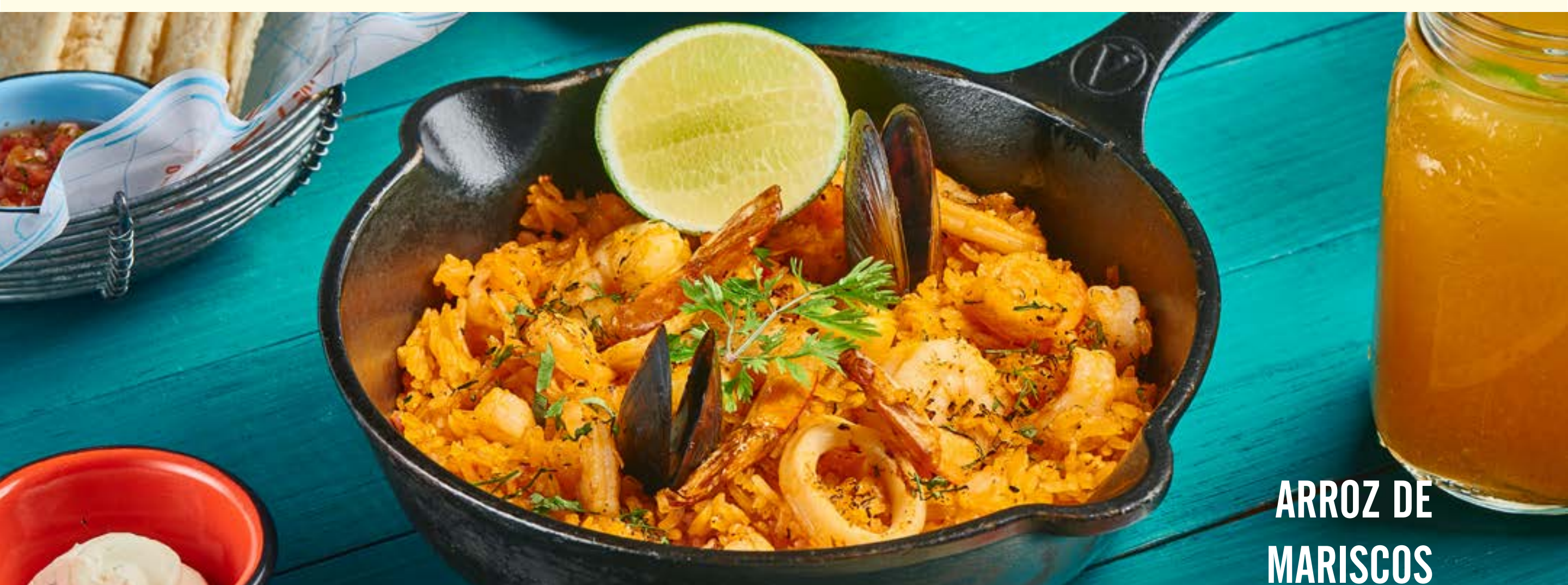
ARROZ DE MARISCOS