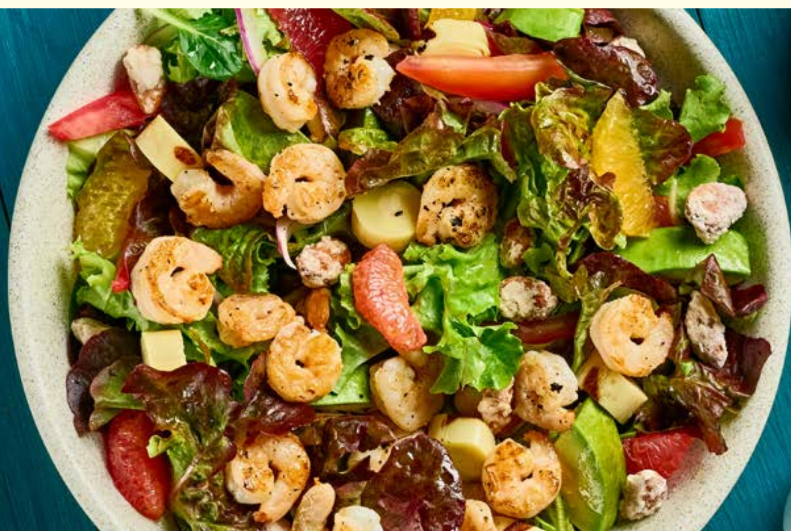
ENSALADA DE CAMARÓN

*También disponible en versión vegetariana.