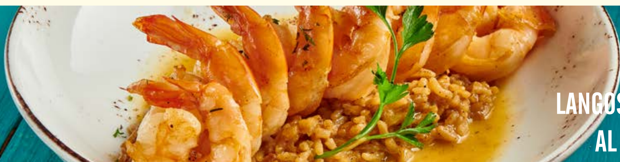
LANGOSTINOS AL TITOTÉ