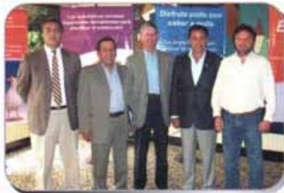
Nuevo Directorio CONAVE