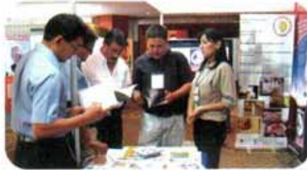
Avicultores del Perú visitan el Stand de CONAVE.

A MEVEA organizó en el mes de Marzo/09 el VIII Congreso de Avicultura en la ciudad de Guayaquil el mismo que tuvo excelente acogida por los avicultores, con esta oportunidad CONAVE presentó un stand con información del Gremio, datos estadísticos, promoción de las Buenas Prácticas Avícolas, el mismo que motivó la atención de los asistentes quienes visitaron y realizaron consultas sobre el sector.