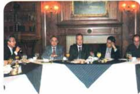
Autoridades del MAGAP, FAO y CONAVE.

El señor Ministro de Agricultura Ing Walter Poveda agradeció por este esfuerzo del sector privado y se comprometió a continuar con este sistema que se inició a nivel piloto y que progresivamente se irá mejorando.