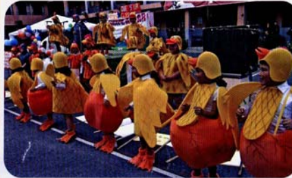
Presentación de las alumnas del Colegio Sagrados Corazones de Rumipamba