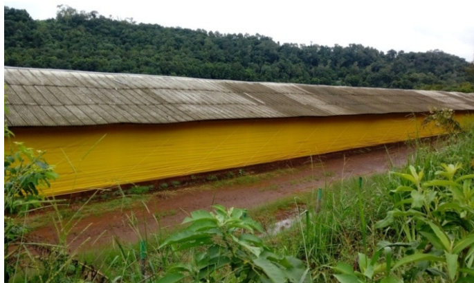
Cobertura de chapas de fibrocimento 4,00 mm