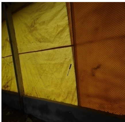
Mureta/Telas e lonas