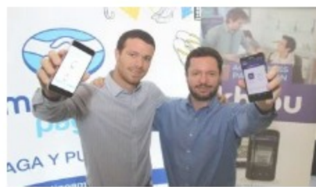
khipu se incorpora a MercadoPago como una alternativa de pagos en internet In "Emprendedores"