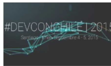
Amazon orientó sobre "Startups" en DEVCON Chile 2015 In "Emprendedores"