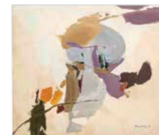
Foto: Alfredo Barbosa de Oliveira, Competência, 2015/ Gabriel Arantes

Nas telas, é possível notar influências do movimento concretista – a arte geométrica e racional serviu como ponto de partida para a produção de Alfredo, desenvolvida no ano de 1990 e no início de 2000 –, mas também uma proximidade com a pop art e com a arte cinética. hubbprojetos.com.br