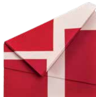
Foto: Fernando Zarif, sem título, sem data/Sebastiano Pellion/Luciana Brito Galeria

A feira, em Bogotá, reúne galerias da América Latina. Estão presentes as brasileiras Luciana Brito, Luisa Strina e Vermelho. Até 4 de outubro. artbo.co