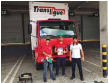
Transligue, em São José dos Pinhais