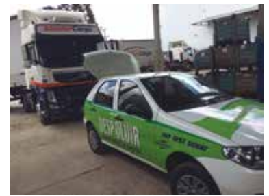
MasterCargo, em Curitiba