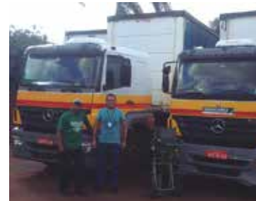
Transportadora Luft, em Londrina