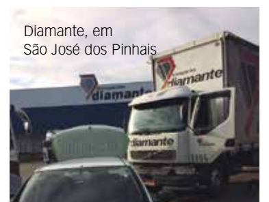
Diamante, em São José dos Pinhais