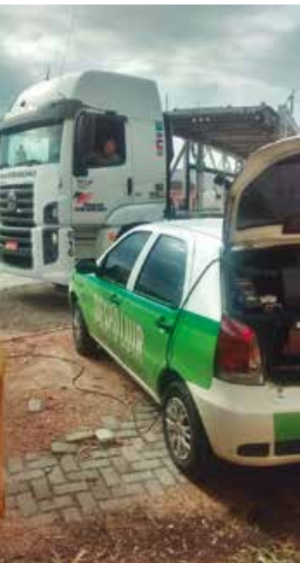
TransMoreno, em São José dos Pinhais