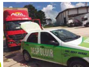
Alfa Transportes, em Curitiba

As empresas que tiverem interesse em participar do Despoluir podem entrar em contato pelo email despoluir@fetranpar.org.br ou pelo telefone (41) 3333-2900.