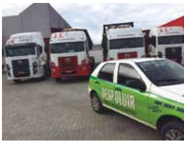
Kraft Transportes Rodoviários de Cargas Ltda., em São José dos Pinhais