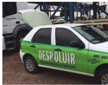
Transauto, em São José dos Pinhais