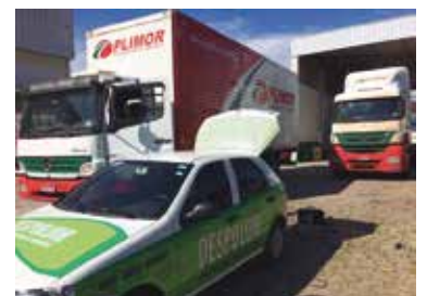
Transportadora Plimor, em Curitiba