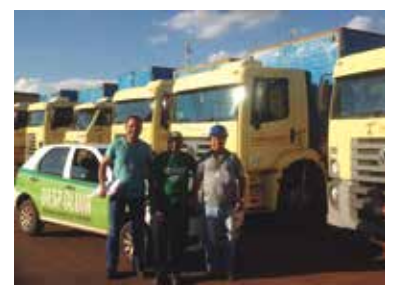
Transcamila, em Londrina