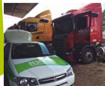
Jadimo Transportes, em São José dos Pinhais