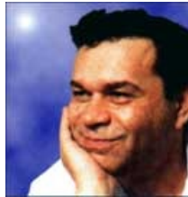
Dr. Eliyahu Goldratt

“Sonrío y comienzo a contar con mis dedos, Uno, la gente es buena. Dos, todo conflicto se puede remover. Tres, toda situación, sin importar qué tan compleja luzca inicialmente, es sorprendentemente simple. Cuatro, toda situación se puede mejorar sustancialmente; incluso el cielo no es el límite. Cinco, toda persona puede alcanzar una vida plena. Seis, siempre hay una solución ganar-ganar. ¿Debería continuar contando?”