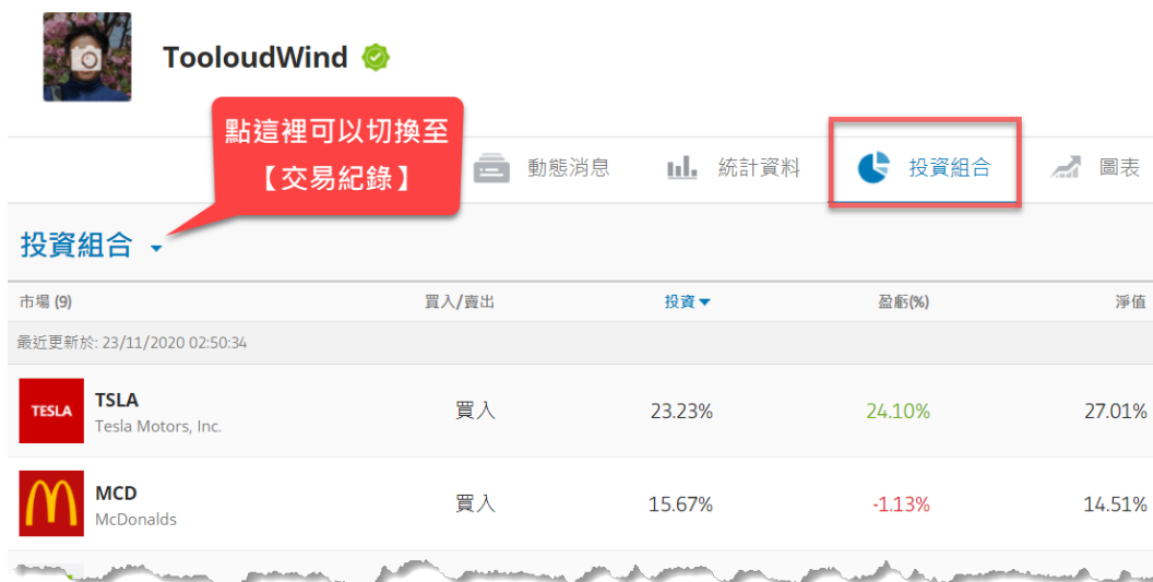
我的 eToro 帳戶

用瀏覽器開啟上述連結後，就會顯示我的 eToro 帳戶首頁。此時可在頁面上方點一下【投資組合】，便可查看我目前的美股投資組合。如下圖：