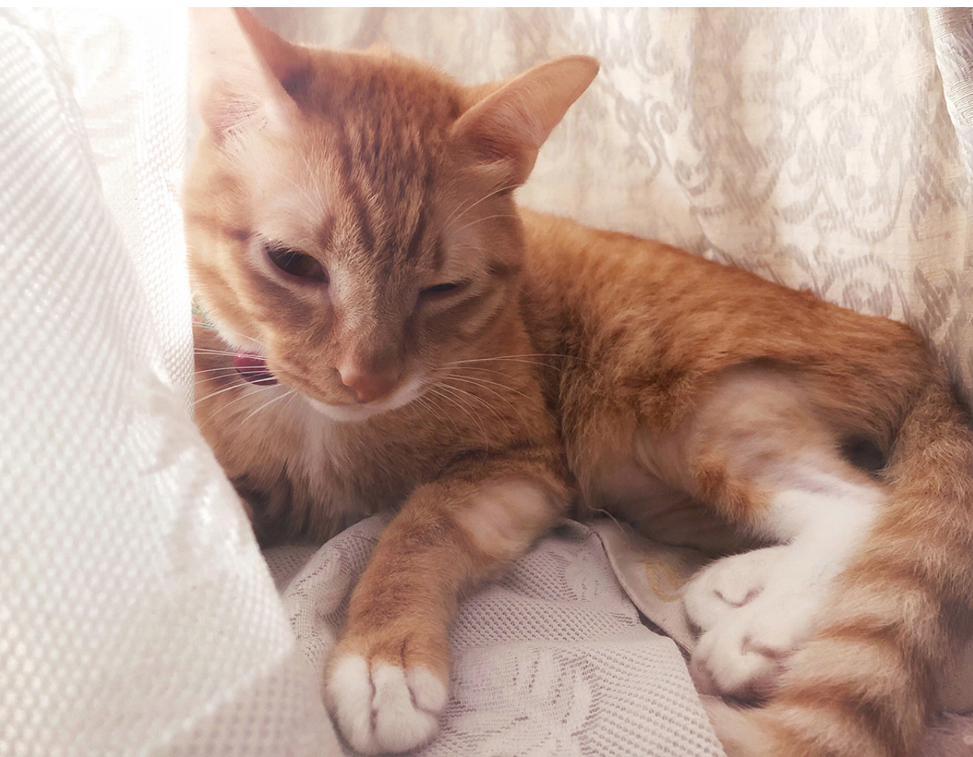
● 皮兒難得沙龍美照