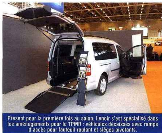
Présent pour la première fois au salon, Lenoir s'est spécialisé dans les aménagements pour le TPMPR : véhicules décaissés avec rampe d'accès pour fauteuil roulant et sièges pivotants.