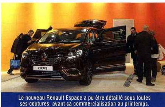
Le nouveau Renault Espace a pu être détaillé sous toutes ses coutures, avant sa commercialisation au printemps.

D écevant, mais surtout surprenant. En ces temps où l'actualité a de quoi inquiéter la majorité des chauffeurs de taxi et où se joue incontestablement l'avenir de la profession, on aurait pu penser que la 12 e édition du Salon des Taxis allait attirer nombre de visiteurs venus s'informer et partager leur expérience avec leurs confrères. Il n'en est rien. Seuls 4 622 visiteurs, dont 3 664 chauffeurs de taxi ont poussé les portes du salon. C'est peu comparé aux 5 800 visiteurs qui avaient fait le déplacement en 2013.