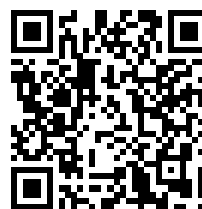
Invia richiesta di inserimento in classifica

AVVISO: Quando si invia una protesta, una richiesta o un rapporto, la procedura rimane invariata (come da Regole di Regata e Istruzioni di Regata).