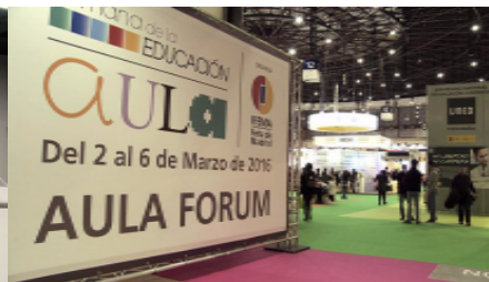
Videonoticia: ICEX-CECO traslada su oferta formativa como escuela de negocios al Foro Postgrado