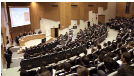
Videonoticia: Becas de Internacionalización ICEX 2018