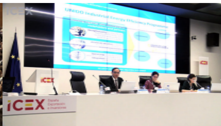
Videonoticia: Spain ONUDI Vendors Day