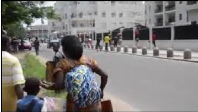
Le gouvernement congolais et les agences du système des Nations unies ont lancé ce samedi 4 juin...