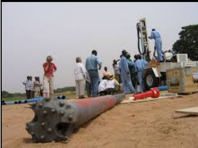
La Nigéria national petroleum corporation (NNPC) a annoncé le lancement dès octobre 2016, des...