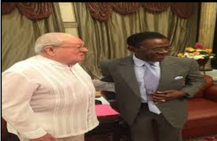
Jean Marie Le Pen, le président d'honneur du Front national (FN), une des forces politiques...