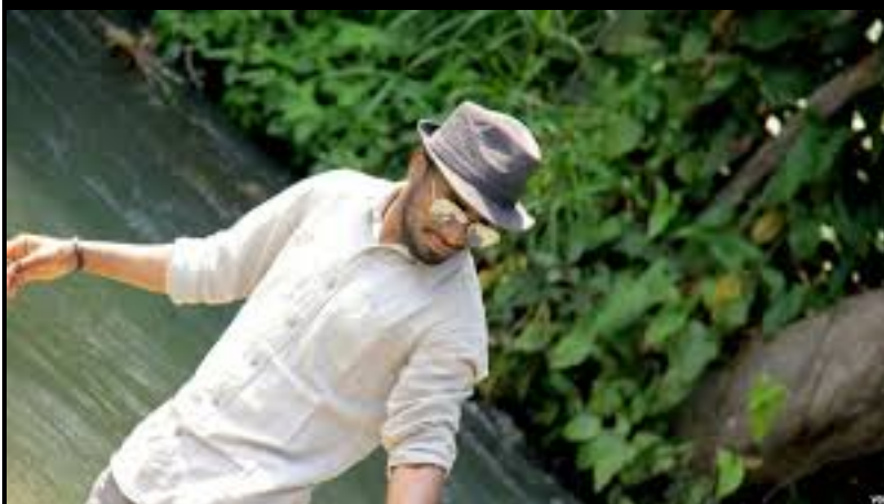
Longtemps absent sur la scène nationale et internationale, le cinéma congolais est à la...