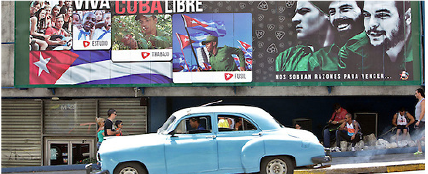
Foto: La empresa estatal Cuba-Petróleo (Cupet) se pronunció por primera vez ante el supuesto hallazgo de una importante reserva de crudo en el centro de la isla y se refirió a "erróneas interpretaciones" sobre la noticia que hace unas semanas difundió la australiana MEO, que inspecciona la zona.

Servicios de Acento.com.do ( http://acento.com.do/author/servicios/ ) - 17 de septiembre de 2016 - 9:00 am -