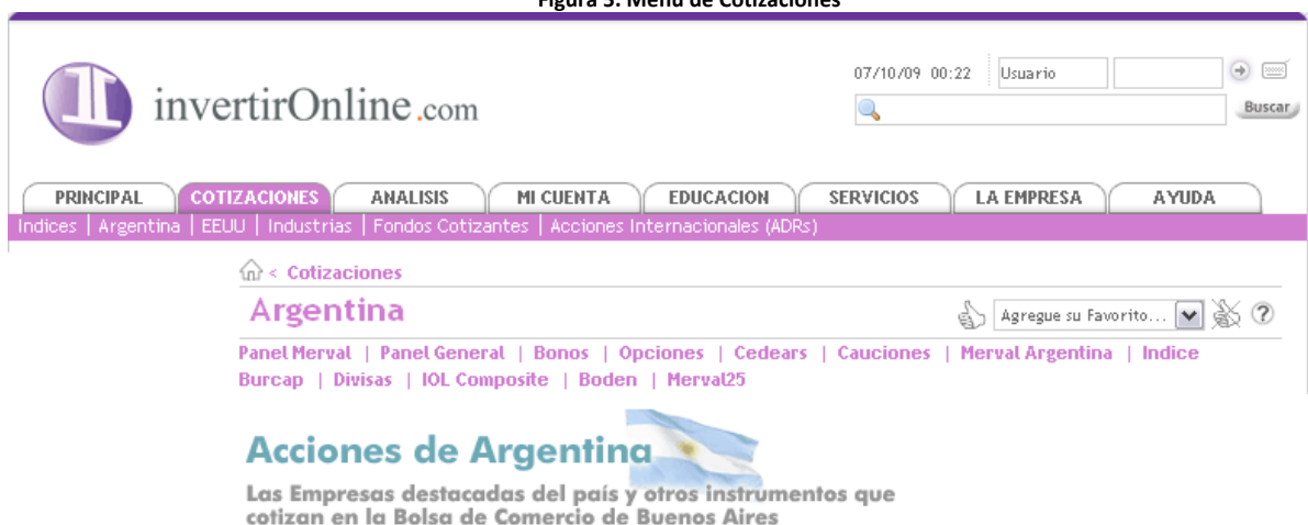
Figura 5. Menú de Cotizaciones