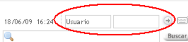
Figura 1. Login del usuario en el extremo superior-derecho del sitio

Luego, en la pantalla de recepción de "Mi Cuenta", acceda en el ícono inferior correspondiente a "Portafolio".