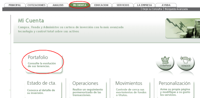
Figura 2. Ingreso a su Portafolio en la sección "Mi Cuenta"

Luego, en la pantalla de recepción de "Mi Cuenta", acceda en el ícono inferior correspondiente a "Portafolio".