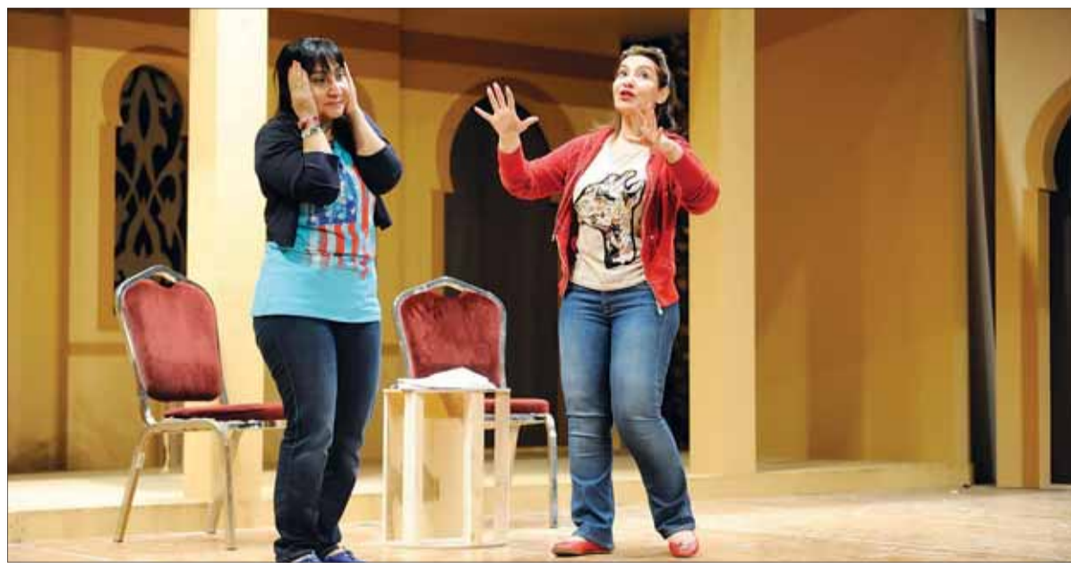
• هدى وسحر تجتمعان معاً من جديد

على مقدراتهم، متبعاً مقولة «الخوف يخفي الحقيقة»، ومن هذه الكلمات انطلقت الكاتبة نجاة حسين لتنسج أحداثاً مسرحية «البنات والطنطل»، التي تدور أحداثها بين الأختين شمسة وقمر وبين أخيهما نمر، الذي يحميها ويحكم عقله بكل الأحداث التي تدور من حوله ليحل اللغز ويكشف الحقيقة.