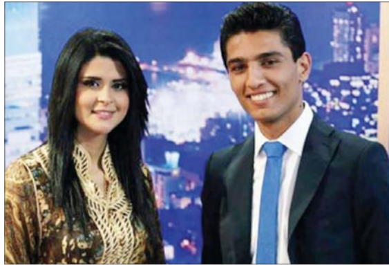
• محمد عساف وسلمى رشيد يجتمعان في الدوحة.