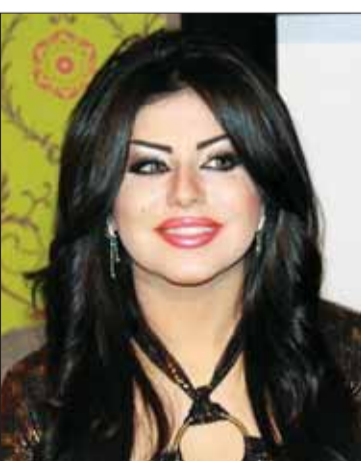
• حليلة بولند