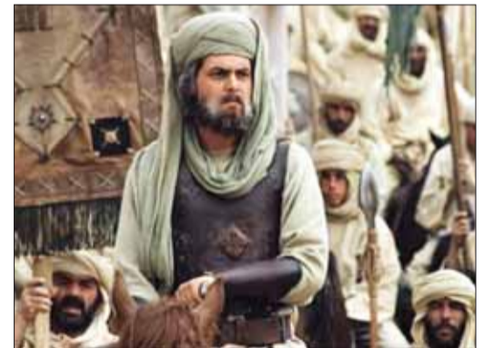
• من مسلسل «عمر»

ورغم النقاش الطويل حول هذه التغريدة لم نجد اجابة محددة على السؤال.