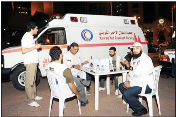
• متطوعو الهلال الأحمر

وبين أن تطبيق الشريعة هو الذي يعد منجاة للبشرية، ومن أنصرف عنها ضل سواء السبيل، فلنك لا نعيش أزمة إيمانية