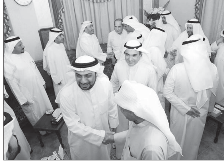
• الزلزلة المجلس ينتظر

وأوضح أن مجلس الأمة يحتوي على جناحين مهمين: الأول جناح الخشوع، والآخر جناح الرقابة. فالتشريع، أنا أتوقع أنه سيتم وينجز على أكمل وجه، وأما الرقابة فتحتاج إلى نواب يلتزمون بها، وذلك حتى يكون الأداء متميزا على الشكل المطلوب.