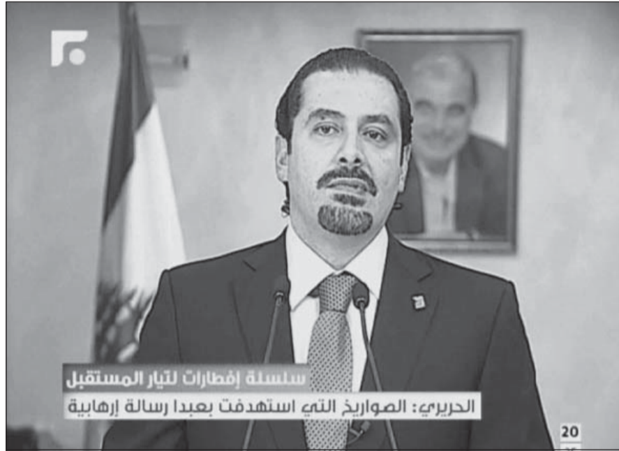
● الحريري مخاطباً جمهوره عبر الشاشة من جدة

ولم يتطرق الحريري الى موضوع عودته الى لبنان بعدما كان قد تردد انه سيقدم على هذه الخطوة في سبتمبر (غادر في ابريل 2011 لأسباب أمنية)، كما نفى ان تكون لديه الرغبة في ترؤس الحكومة، داعياً الى التعاون مع الرئيس المكلف تمام سلام.