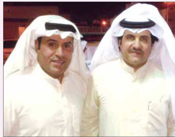
• سلطان اللغيصم الشمري وفهد الحميدي

هنأت عائلة الحميدي النائب سلطان اللغيصم الشمري بمناسبة نجاحه بالمركز الأول بمجلس الأمة عن الدائرة الرابعة، حيث قام عدد من ابنائها بزيارة النائب وباركوا له النجاح آمين ان يكون صوت المواطن وضميره في المجلس، وتمنوا له التوفيق.