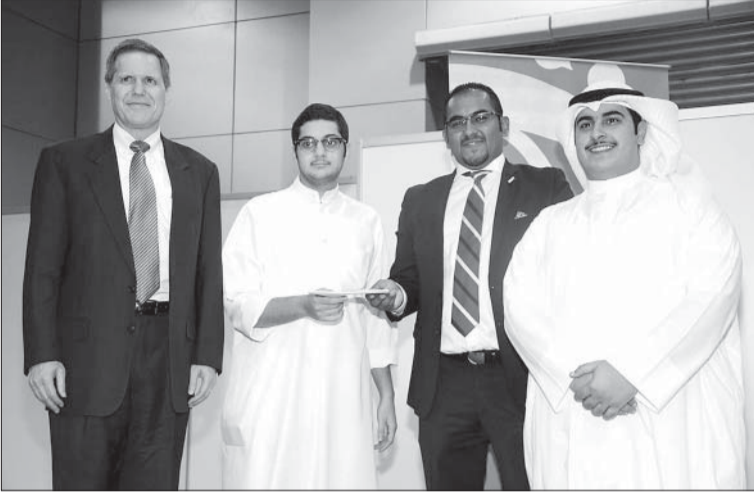
السفير الأميركي متوسط الكاظمي والراجل