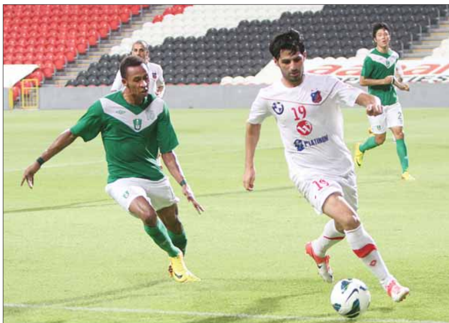
● من لقاء الكويت والأهلي

في عام 2009، بينما شارك الأهلي السعودي مرتين ونال أول بطولة لها في عام 2005 واحتل المركز الثالث في النسخة الماضية الذي يحمل لقبها نادي القادسية.