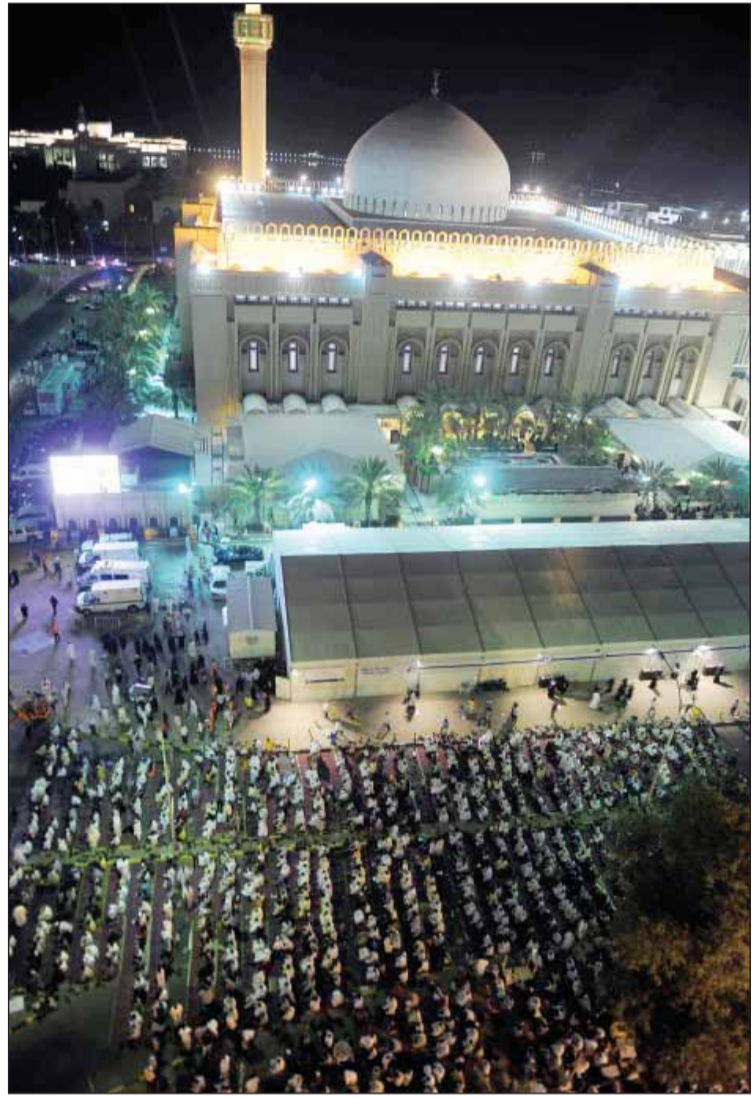
● احياء ليلة القدر بالطاعة والعبادة والابتغال والدعاء

سُئلت لجنة الفتوى في وزارة الاوقاف والشؤون الاسلامية عن موضوع ليلة القدر واختلاف مطالع الهلال، ونص السؤال يقول: ان المواثيق الكوييتيين - على سبيل المثال - يصومون يوماً قبلنا، واذا افترضنا ان ليلة القدر تكون في ليلة السابع والعشرين فانها في الكويت ستكون يوم الأحد، وفي المغرب يوم الإثنين.. فهل ليلة القدر تأتي في ليلة واحدة بالنسبة إلى العالم كله؟ اذا كان الجواب «نعم»، فإن احد البلدين سيضيع بركة ليلة القدر. أرجو منكم الجواب. فجابت اللجنة بما يلي: ليس ليلة القدر وقت محدد، وانما جاءت السنة بتحريها في شهر رمضان، وفي العشر الأواخر منه، ليكون هذا تحفيزاً على الاجتهاد في العبادة طيلة هذه الليالي المباركة. فإذا اجتهد المسلمون في طلبها والعبادة فيها رجي ان يصادفوها مهما اختلفت المطالع، والله أعلم.