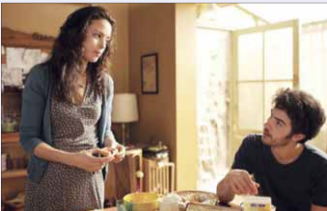
• مشهد من فيلم «الماضي»