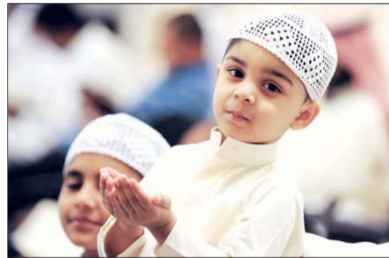
• طفولة وإيمان

أن اللجنة الإعلامية في تواصل دائم وفعال مع وسائل الإعلام المرئية والمقروءة والمسموعة، لتمكينها من نقل وقائع صلاة التهجيد والقيام بشكل مباشر، وتذليل كل الصعوبات التي قد تعترض مهام رجال وسائل الإعلام المختلفة، علاوة على التنسيق مع الجهات المشاركة والمشايخ ورجال الدين والدعاة لحلقة الاستوديو الذي تبث مباشرة على قناة إثراء بشكل مباشر يومي قبل الانتقال لنقل شعائر صلاة التهجيد والقيام.