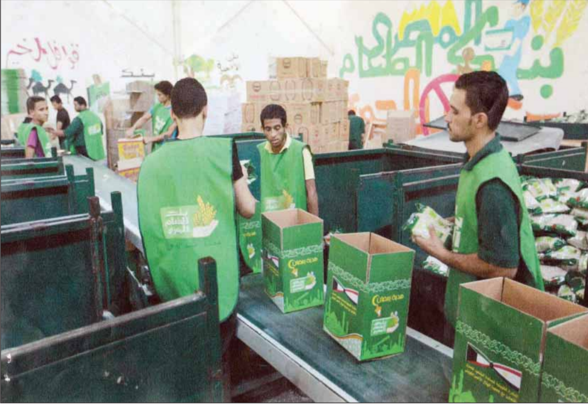
• الوجبات الغذائية لمساعدة الشعب المصري