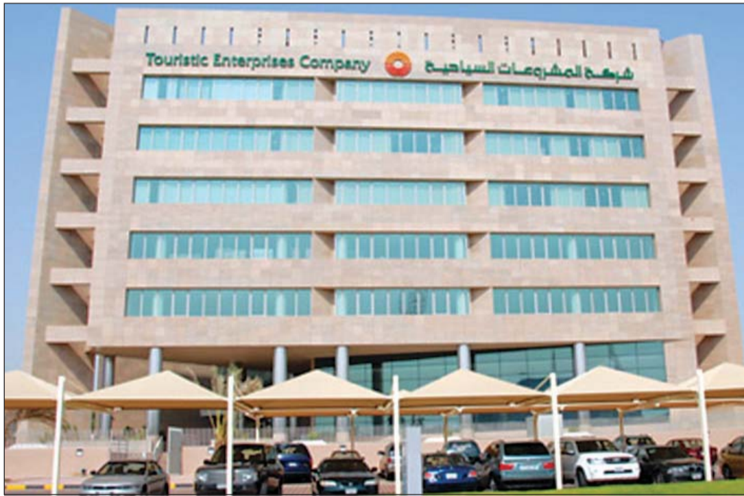
عراقيل عدة أمام خصخصة «المشروعات السياحية»

وتقول لا جدال في أن الهيئة سوف تحرص على مراعاة البعد الاجتماعي للخصخصة فضلاً عن الأبعاد الاقتصادية، وهو البعد الذي يقضي بتقرير الضمانات