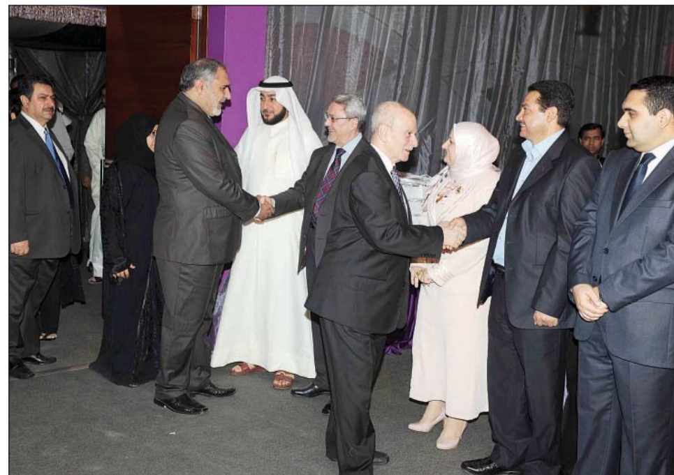
يستقبل وأركان السفارة أبناء الجالية