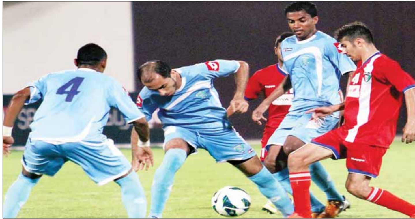
● جانب من مباراة الأولمبي والفتح