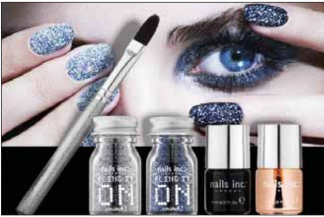
● مستحضرات nails inc

يسر علامة قافاقووم، التي تشتهر بتخصصها في عالم الجمال والصحة وتقديم كل ما هو جديد وتميز من المنتجات العالمية الحصرية والمبتكرة في مجال العطور ومستحضرات التجميل ومنتجات العناية بالبشرة وطلاء الأظافر، أن تعلن عن وصول ماركته Nails inc إلى جميع فروعها في الكويت. ماركته Nails inc مستحضرات التجميل وطلاء الأظافر الشهيرة في المملكة المتحدة والتي استوحيت ابتكاراتها من عروض الأزياء العالمية في لندن تقدم الآن تشكيلات جديدة من طلاء الأظافر التي تعتبر الاختيار الأمثل لمتبعي خطوط الموضة العصرية وبأسعار تناسب الجميع. وفي هذا الإطار، نجح فريق Nails inc، التي حصدت الكثير من الجوائز في أسبوع الموضة في لندن، والذي وغالبا ما يعمل بصمت وراء الكواليس بالتعاون مع أشهر المصنمين لعرض مجموعة من الألوان الرائعة التي تتوافق وصيحات الموضة لهذا الموسم. بعد عرضها للمرة الأولى في قافاقووم في الكويت، نجحت Nails inc في نيل رضا الكثير من النساء الكويتيات اللاتي يعرف عنهن شغفهن بالأناقة ومتابعتهن لأحدث صيحات ألوان طلاء الأظافر والمنتجات.