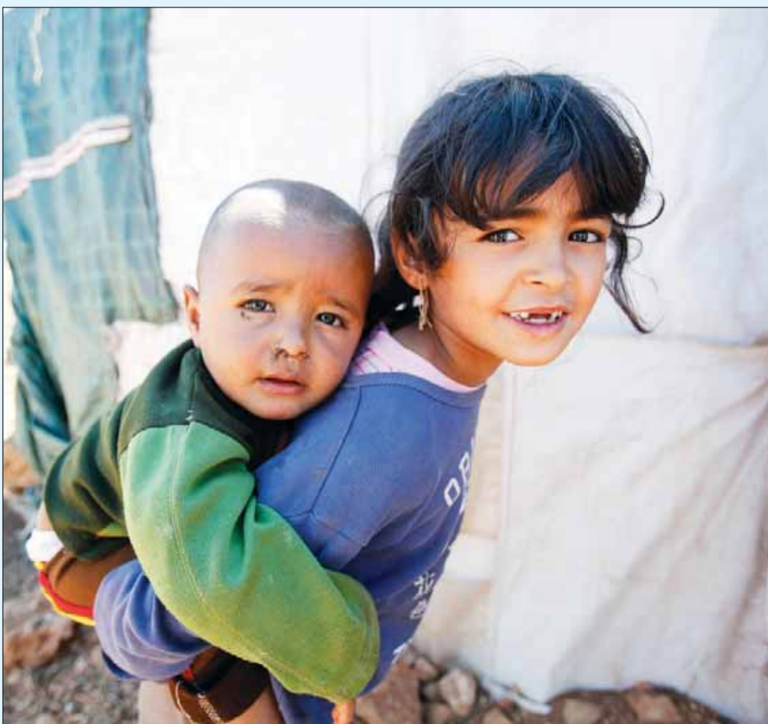
• فتاة سورية تحمل طفلاً في مخيم كفر زيد للاجئين السوريين في البقاع (غرب لبنان)

وتضاعف عدد اللاجئين السوريين في المنطقة خلال الأشهر الأربعة الماضية مع دخول الصراع في سوريا إلى مرحلة أكثر دموية. ويستقبل