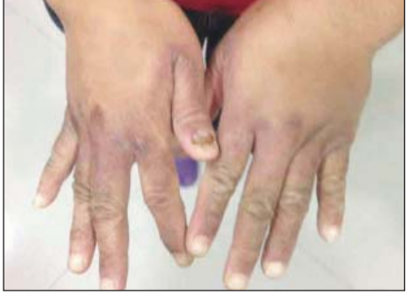
• آثار التعذيب على يدي الخادمة