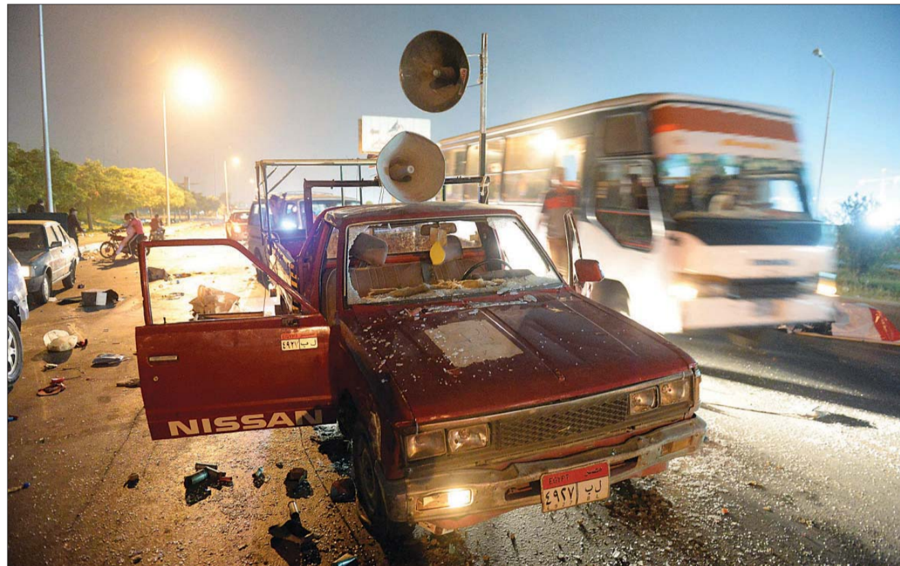
سيارة عليها مكبرات للصوت كانت تعرض المتواجدين عند مدينة الإنتاج الإعلامي خلال الاشتباكات ليل الجمعة

وبالتوازي مع التحركات الدبلوماسية المكثفة فقد جددت وزارة الداخلية دعوتها للمعتصمين في