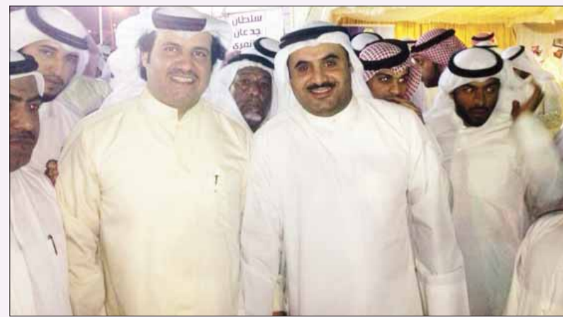
• مع وليد الحميدي

هنأت عائلة الحميدي النائب سلطان اللغيصم الشمري بمناسبة نجاحه بالمركز الأول بمجلس الأمة عن الدائرة الرابعة، حيث قام عدد من ابنائها بزيارة النائب وباركوا له النجاح آمين ان يكون صوت المواطن وضميره في المجلس، وتمنوا له التوفيق.