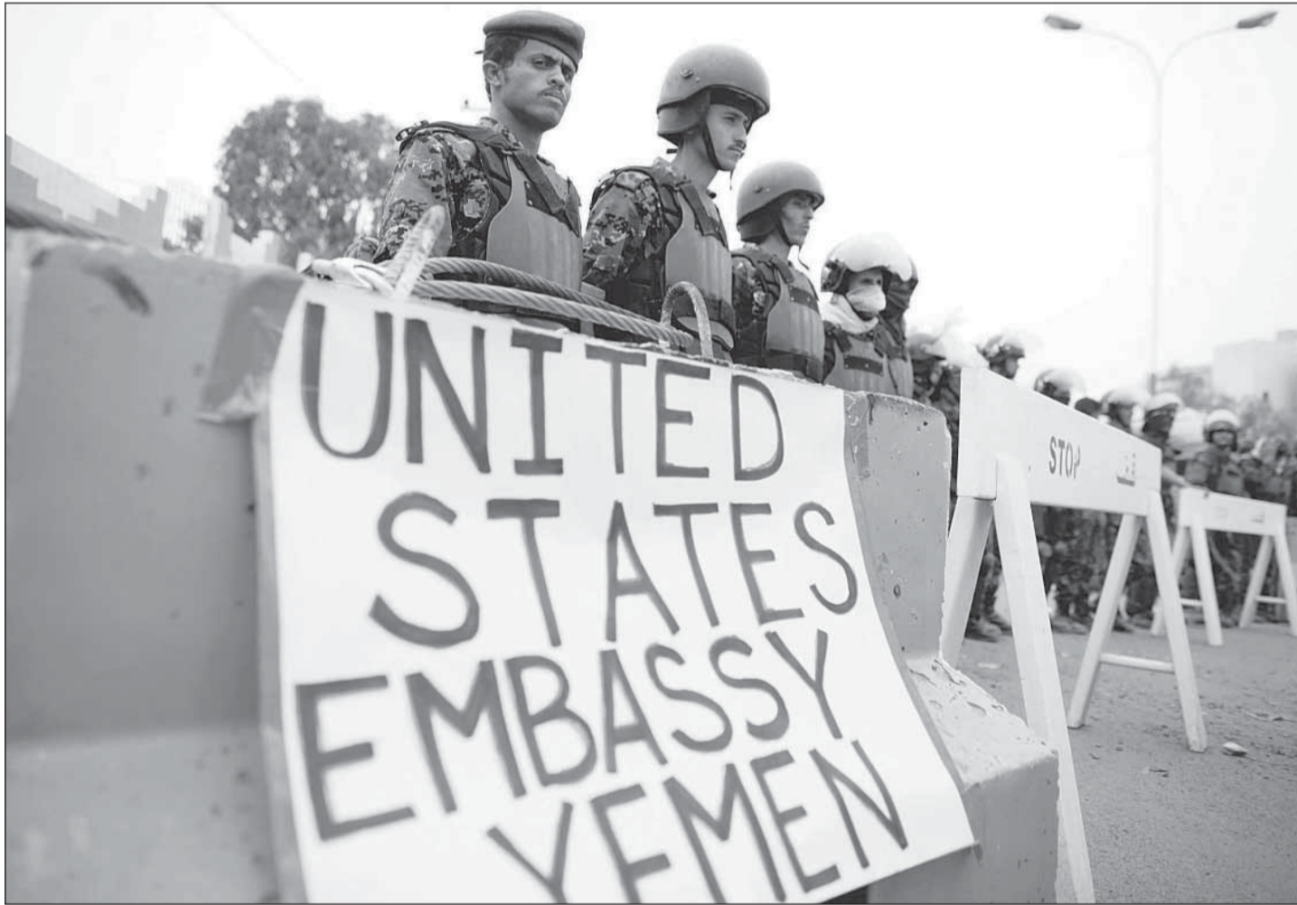
صورة أرشيفية تظهر إجراءات أمنية مشددة حول السفارة الأميركية في صنعاء

من ناحية أخرى، تصدر محكمة تركية في مدينة سيلفري قرارها النهائي في الخامس من الجاري بحق المتهمين في قضية ارغونغون الخاصة بمحاولة انقلاب عام 2007 والمستمرة منذ 2008، حيث عقدت 321 جلسة حتى الآن. وطالبت النيابة باحكام رادعة ضد جنرالات وصحافيين متهمين بمحاولة الإطاحة بحكومة رجب طيب اردوغان. من جهته، أعلن محافظ إسطنبول حسين عوني موطلو عدم السماح بحضور أقرباء المتهمين والمواطنين الجلسة، وبإي تجمعات، وسيسمح بحضور النواب والمحامين والصحافيين.