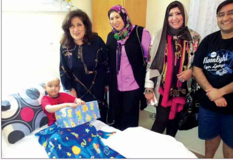
• توزيع الهدايا