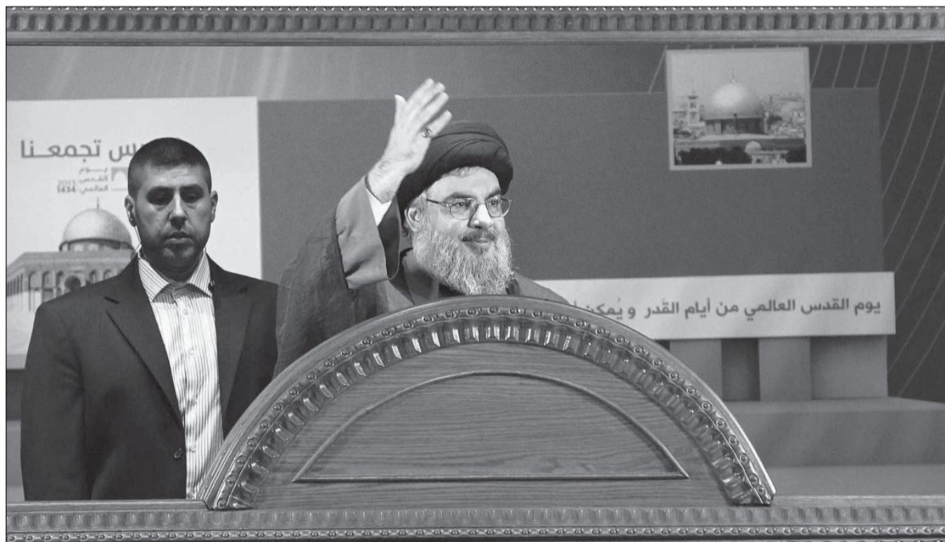
● نصرالله في ثاني ظهور علني له منذ عام خلال الاحتفال بيوم القدس

نصر الله كرس معظم خطابه للقدس وفلسطين، داعياً الى «الحوار الداخلي» في الدول العربية والاسلامية التي تعاني التوتر. والمفاجأة الثالثة انه تحدث هذه المرة شيعي، وليس كلبناني عربي، وإن انتقد حملات التحريض المذهبي ضد الشيعة، قال: