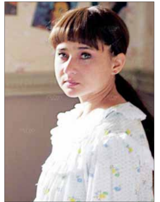
• نيللي كريم في مسلسل «حكاية بنت اسمها ذات»

بسبب نجاح المسلسلات الأخوذة من روايات لروائيين كبار هذا العام، مثل مسلسل «حكاية بنت اسمها ذات» المأخوذ من رواية «ذات» لصنع الله إبراهيم، ومسلسل «موجة حارة» المأخوذ من رواية «منخفض الهند الموسمي» لأسامة أنور عكاشة، نتوقع ان كثيرين سيتجهون إلى عالم الروايات في الموسم المقبل، والاستفادة منها في مسلسلاتهم كالعادة. نذكرهم انه ليس كل الروايات تصلح لأن تكون مسلسلات، فرواية «عمارة يعقوبيان» عندما تحولت الى مسلسل فشل فشلا ذريعا!