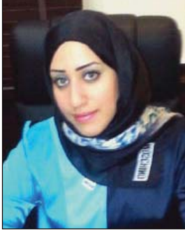
• حوراء الحبيب

معه وردعه من خلال حبسه، وغير ذلك لن نسمح به، لأن هؤلاء بشر جاؤوا ليكسبوا لقمة العيش بالحلال، لكن بعضهم يعتقد أننا في زمن العبودية، وأن هؤلاء جاؤوا ليهانوا.