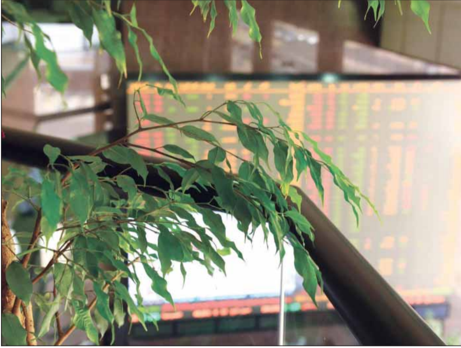
السوق بأمس الحاجة إلى قانون عصري لتصفية الشركات

أ - إذا كان المدين الذي هو شخص طبيعي يحق له أن يعفى من الممتلكات كل ما يلي: 1 - الملابس، والأثاث، وأدوات التجارة، وغيرها من الأشياء التي يحتاج إليها المدين وأسرتة بقيمة لا تتجاوز المبلغ المحدد، وفقاً للقواعد التي اعتمدها المحكمة التجارية لهذه الأشياء. 2 - مقر الإقامة الرئيسي الذي يقيم فيه المدين وأسرتة بقيمة لا تتجاوز المبلغ المحدد لهذه الإقامة من قبل القانون. ب - من أجل إعفاء الممتلكات، يجب على المدين إيداع