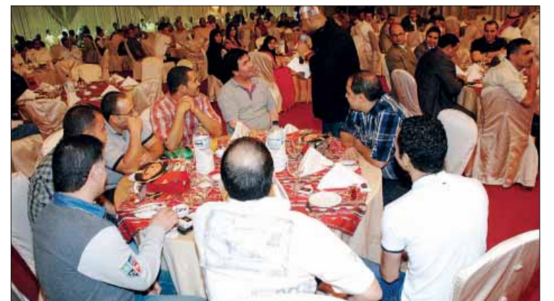
• فقرات للحضور