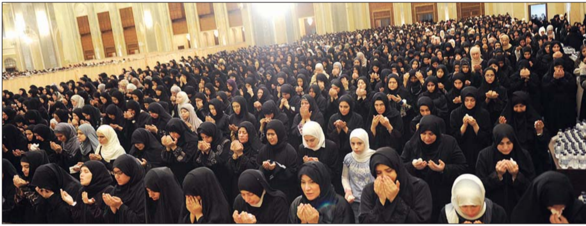
• جموع النساء في صلاة القيام

أن اللجنة الإعلامية في تواصل دائم وفعال مع وسائل الإعلام المرئية والمقروءة والمسموعة، لتمكينها من نقل وقائع صلاة التهجيد والقيام بشكل مباشر، وتذليل كل الصعوبات التي قد تعترض مهام رجال وسائل الإعلام المختلفة، علاوة على التنسيق مع الجهات المشاركة والمشايخ ورجال الدين والدعاة لحلقة الاستوديو الذي تبث مباشرة على قناة إثراء بشكل مباشر يومي قبل الانتقال لنقل شعائر صلاة التهجيد والقيام.