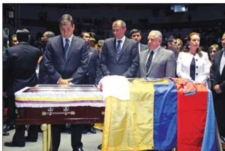
● راقايل كوريا رئيس الإكوادور خلال مشاركة في مراسم الجنازة

وقال لويس تشيريبوغا، رئيس الاتحاد الإكوادوري لكرة القدم أن الفحص خلص بأن بينيتيز كان «مقدراً له الموت»، بسبب مشكلة في الشريان التاجي «يمكن اكتشافها فقط بعد وفاته».