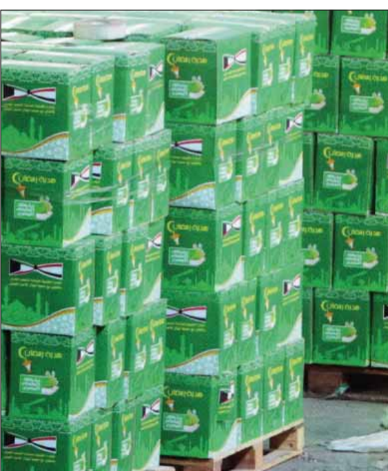
• جاهزة للتوزيع

شدد الطراح على أن المبادرة تتيح المجال لكل راغب في الانضمام إليها، قائلاً: أبوابنا مفتوحة للأفراد والمؤسسات الكويتية الراغبة في المساهمة في دعم الشعب المصري في محتته لحين استقرار ظروفه المعيشية.