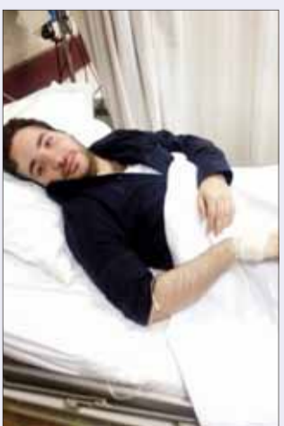
• العلي طريح الفراش