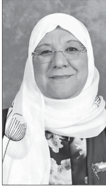
• معصومة المبارك

وقال الهرشاني لـ «القبس» إن رئاسة جابر المبارك ستفتح أفقا واسعا أمام تعاون المجلس والحكومة للعمل على تحريك التنمية والانجاز، وعلى الجميع مد يد التعاون من أجل رخاء البلد واستقراره.