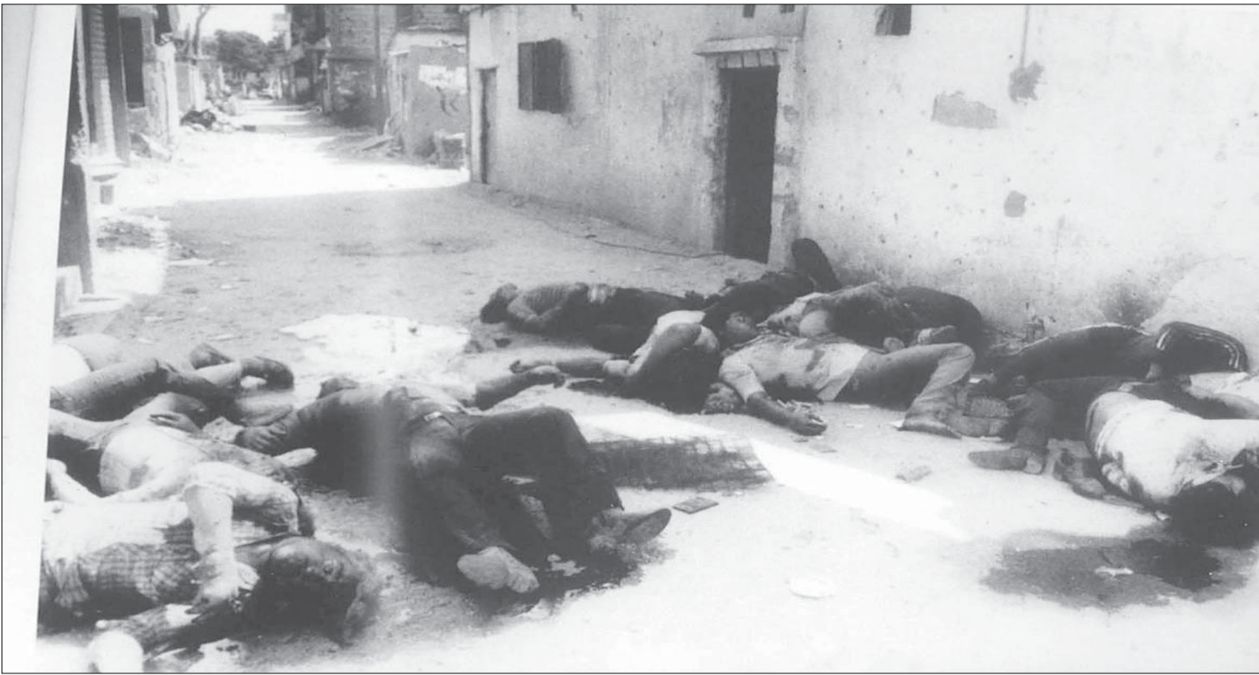
• ضحايا مخيمي صبرا وشاتيلا في بيروت خلال الغزو الاسرائيلي عام 1982

بدا أن «العامل الإيراني» كان دافعاً أساسياً وراء المشاركة الرمزية في القوة المتعددة الجنسيات التي كان يجري تشكيلها لمساعدة حكومة الرئيس أمين الجميل الأولى، والتي كانت تحاول إعادة تشكيل البنية اللبنانية بعد الغزو الإسرائيلي وإخراج منظمة التحرير من الجنوب ومن بيروت.