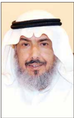
● علي الكليب

وزارة الأوقاف، وهو ما أقرته الندوة السادسة لقضايا الزكاة المعاصرة.