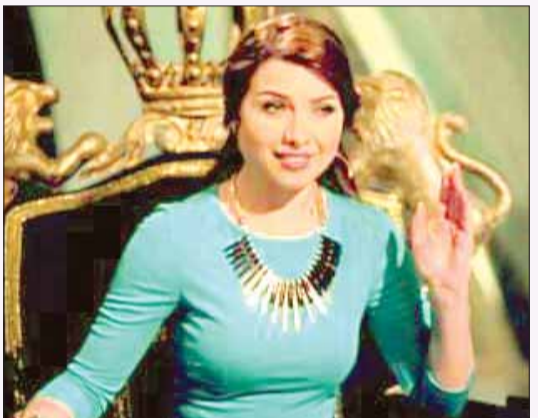
• من برنامج «أبو زعبل»

يعني من قلة الأسماء علشان يظهر برنامج تلفزيوني اسمه «أبو زعبل»؟ «أبو زعبل» برنامج مقابلات يذاع على إحدى القنوات المصرية الخاصة، وتقدمه مذيع لا أعرف اسمها، لكنها صدقة أنها وكيل نيابة.. تحقق مع ضيوفها في جو من الرعب والاكشن الذي لا يحتوي أي هدف أو مضمون!