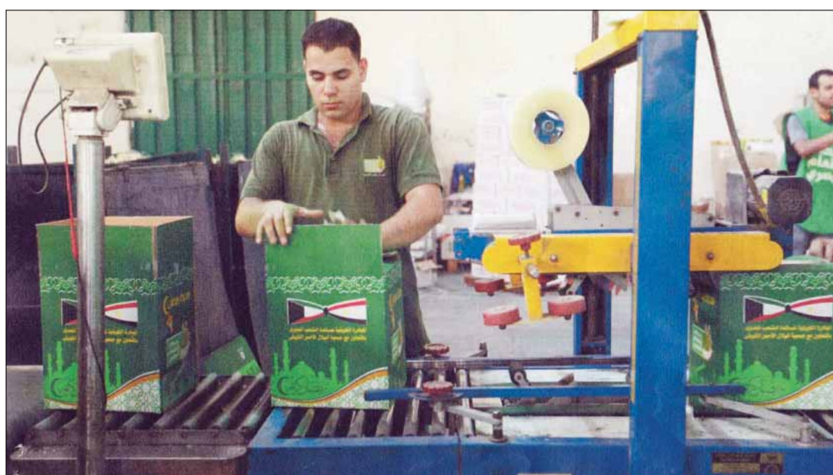
• إعداد الوجبات