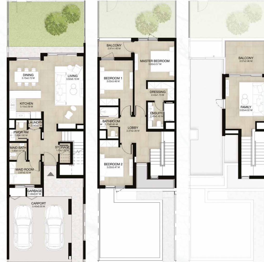
GROUND LEVEL الطابق الأرضي FIRST LEVEL الطابق الأول ROOF LEVEL السطح

3 غرف نوم + غرفة عائلية و غرفة خادمة - الوحدة المتوسطة (معكوسة) المساحة الكلية: 238.55 متر مربع / 2,568 قدم مربع 3-BEDROOM+FAMILY & MAID - MID UNIT (MIRRORED) TOTAL AREA: 238.55 SQM / 2,568 SQFT