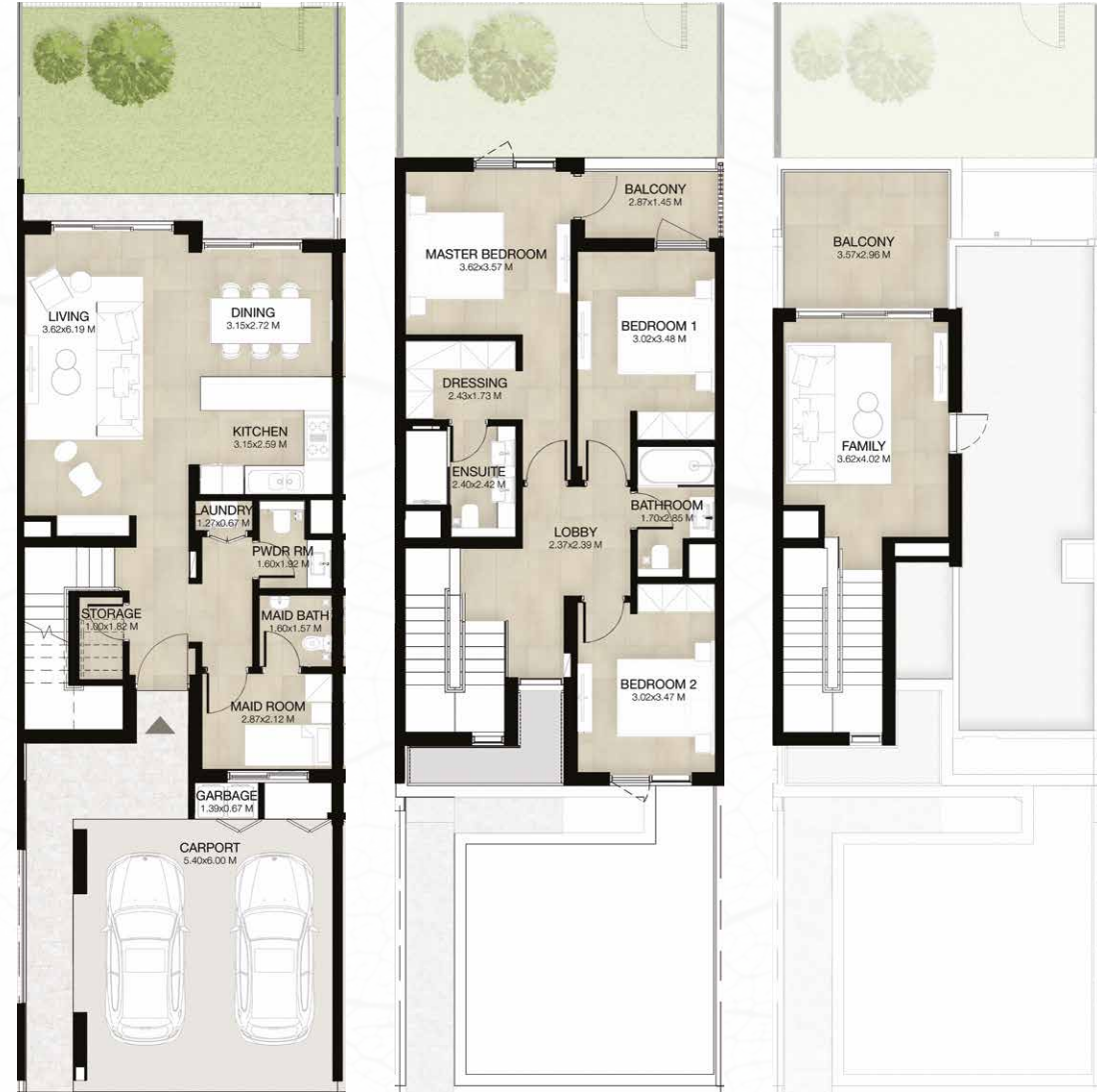
GROUND LEVEL الطابق الأرضي FIRST LEVEL الطابق الأول ROOF LEVEL السطح

3 غرف نوم + غرفة عائلية و غرفة خادمة - الوحدة المتوسطة المساحة الكلية: 238.55 متر مربع / 2,568 قدم مربع 3-BEDROOM+FAMILY & MAID - MID UNIT TOTAL AREA: 238.55 SQM / 2,568 SQFT