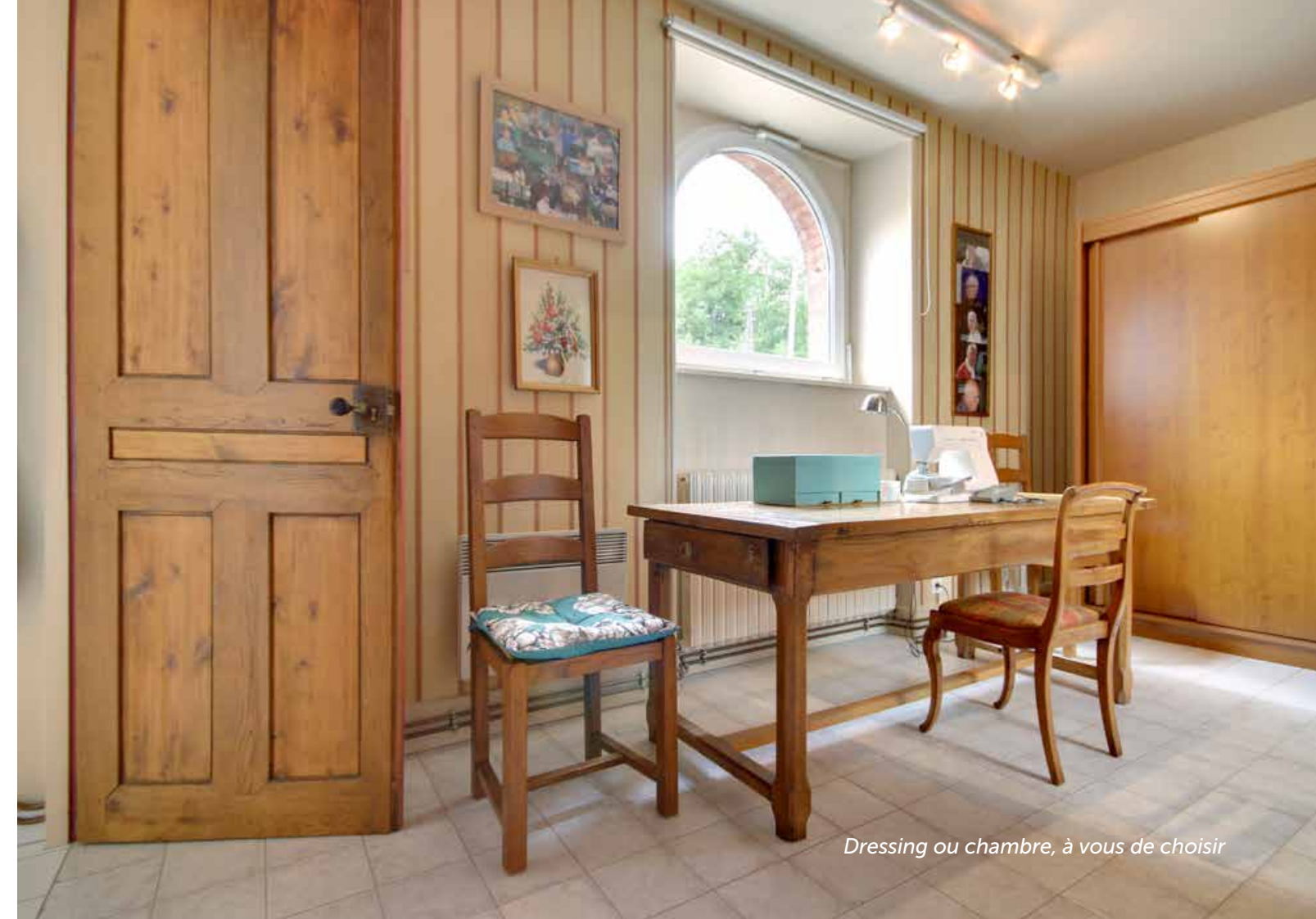
Dressing ou chambre, à vous de choisir