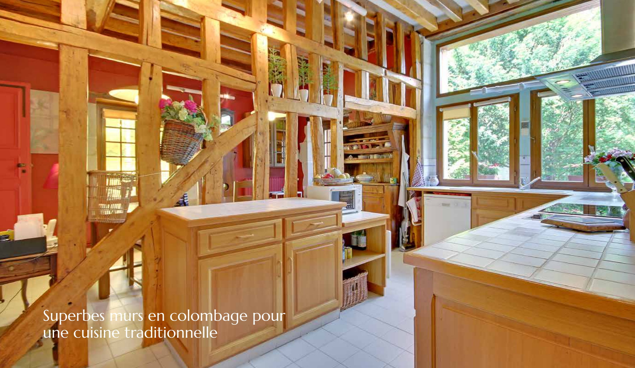
Superbes murs en colombage pour une cuisine traditionnelle

carrefours de foires ou les pays de toute l'Europe et de l'Orient se retrouvaient pour commercer sous les auvents de l'église Saint-Pierre. Aujourd'hui petite ville calme, la vie file avec le cours de la rivière. Le champagne est le mot qui vient à l'esprit quand on mentionne cette région qui a également plusieurs industries et l'agriculture pour soutenir l'économie locale.