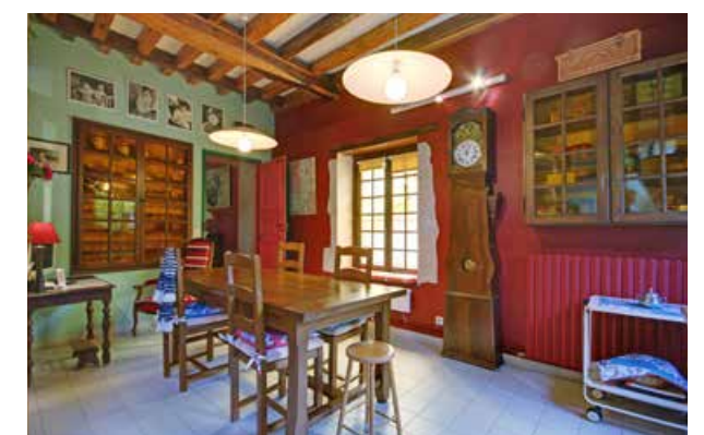
Parfait pour les petits-dejeuners