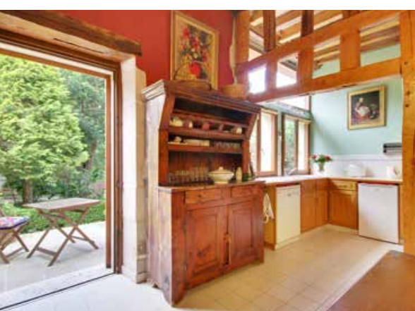
Une cuisine extrêmement fonctionnelle et spacieuse