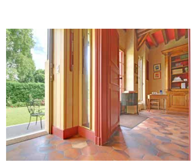
Grande élégance du séjour

Espace salon / salle à manger Cuisine 2 Chambres double/bureau avec salle de bain Dressing Premier étage Grande chambre à coucher Chambre double avec salle de bain Toilettes séparées Salle de jeux Grenier et combles Double garage Piscine Pool House