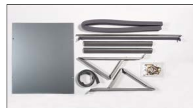
KWIKSB, KWIKMB, KWIKLB