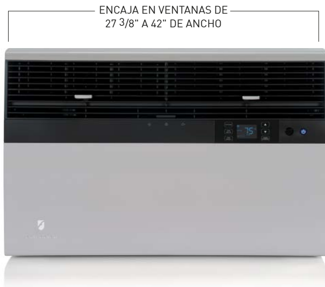
Modelos Kühl SS, SM y SL Modelos Kühl+ ES, YS, EM, YM, EL y YL

Ajuste la TEMPERATURA y las VELOCIDADES DE VENTILADOR, establezca el MODO AUTOMÁTICO y PROGRAME EL ENCENDIDO Y APAGADO.