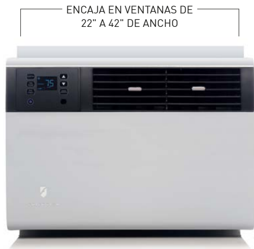
Modelos Kühl SQ/EQ