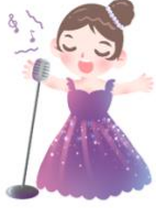
chàng gē 唱歌