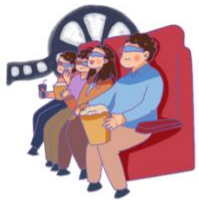
kàn diàn yǐng 看电影