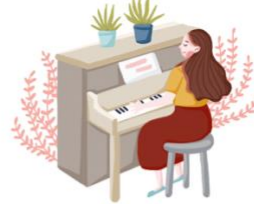
tán gāng qín 弹钢琴