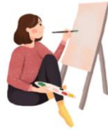
huà huà er 画画儿