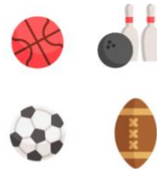
yùn dòng 运动