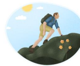
pá shān 爬山