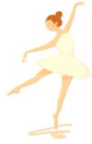
tiào wǔ 跳舞