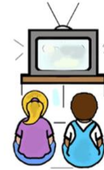
kàn diàn shì 看电视