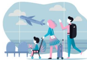
lǚ yóu 旅游