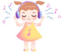
tīng yīn yuè 听音乐