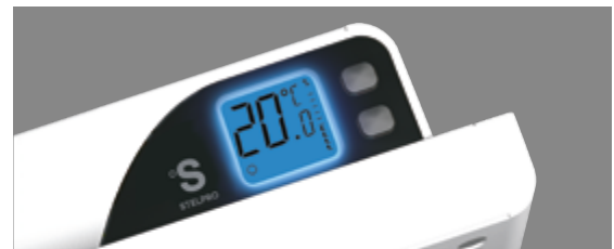
THERMOSTAT ÉLECTRONIQUE INTÉGRÉ EN OPTION POUR LES MODÈLES DE 120 V À 240 V

Les relais électroniques peuvent recevoir un signal pulsé (PWM) ou tout ou rien (on/off). * Installation en usine