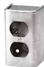
1199 (Pour réceptacle double)