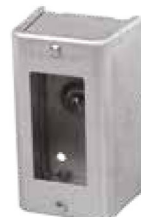
1198 (Pour Decora ou DDFT)