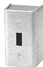
1151 (Pour interrupteur)