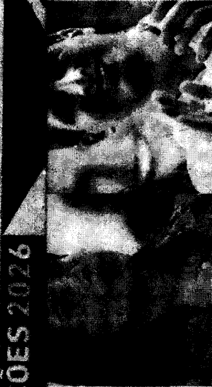
RAQUEL LYRA e João Campos devem ser adversários na disputa pelo Governo de Pernambuco nas próximas eleições

O prefeito do Recife, João Campos (PSB), planeja lançar a pré-candidatura ao Governo de Pernambuco nesta sexta-feira, 20. A chapa do prefeito deve incluir o senador Humberto Costa (PT) e a ex-deputada federal Marília Arraes (PDT).