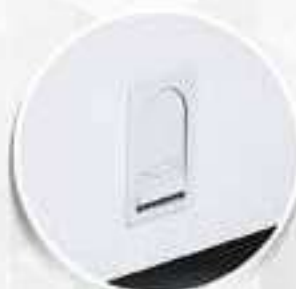
Dreno frontal com tampa

Imagens ilustrativas e que podem ser alteradas sem aviso prévio.