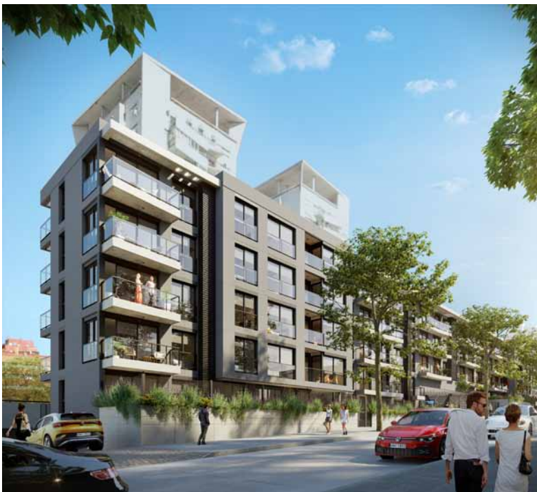
Flow by Nostrum