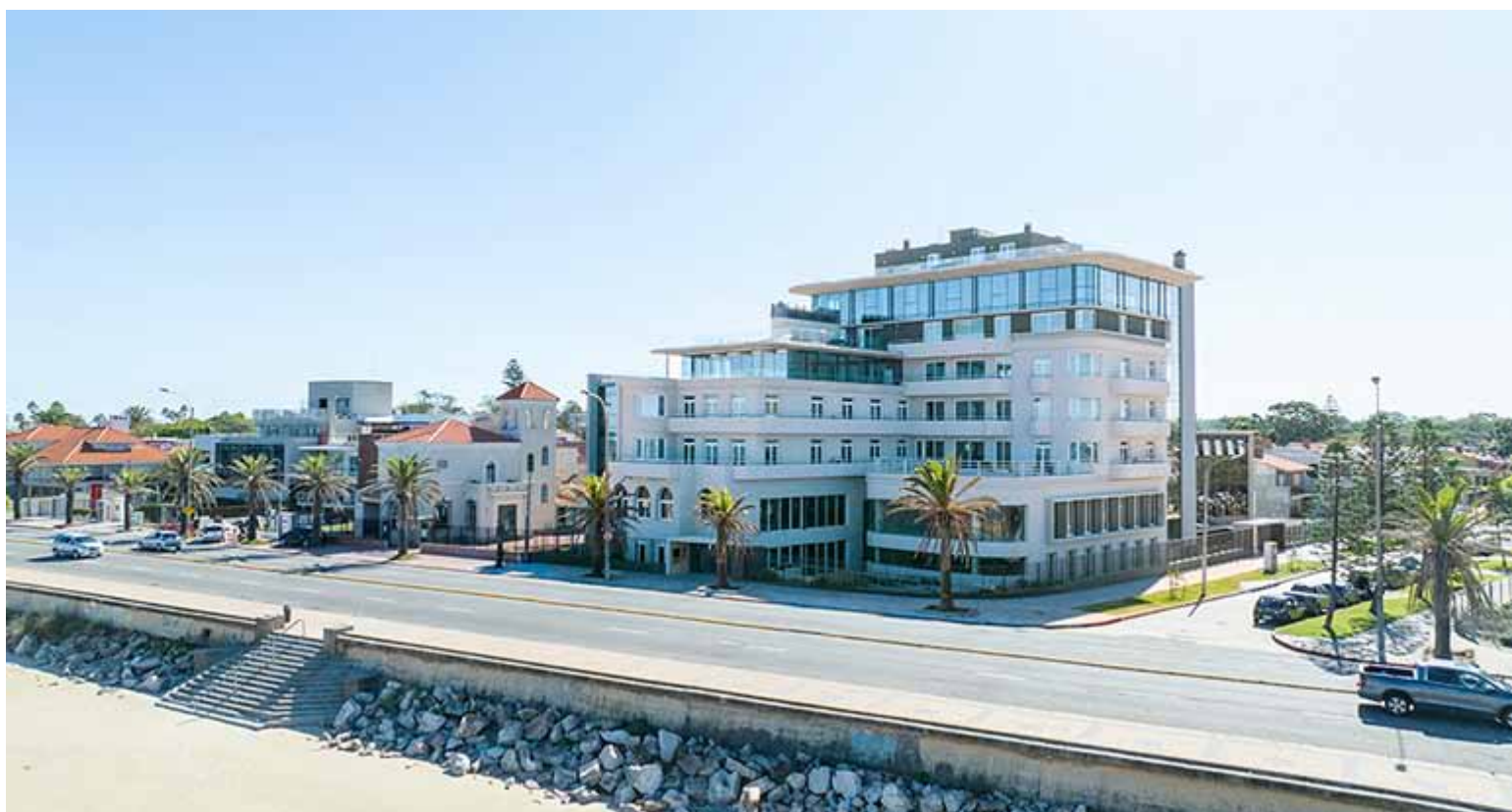
Bilú Riviera - distinguido en los premios LADI en la categoría Reconversión

Los edificios de Altius Group revolucionaron el mercado inmobiliario de Montevideo, en gran parte por su propuesta de amenidades “las cuales se destacan por su