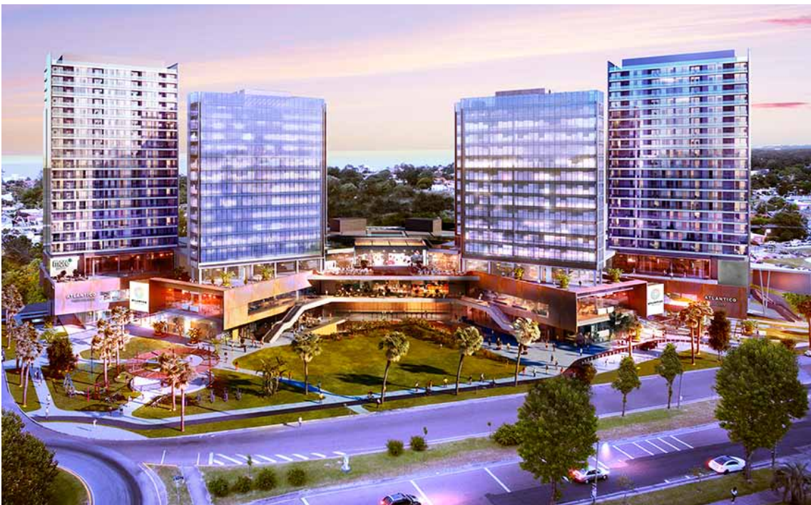
Proyecto Atlántico Punta del Este

de Canelones, llega con una propuesta innovadora que promueve el bienestar compartido. Pensando en el estilo de vida de los residentes se eligieron amenities que potencien el disfrute y el contacto con la naturaleza. El proyecto contempla la construcción de muelles privados, piscina, sala de juegos para niños, gimnasios con diferentes equipamientos, fogones y living para disfrutar la vista de los lagos. Todas las unidades cuentan con parrillero individual. Cada detalle está diseñado para elevar la experiencia de vivir en armonía con el entorno y con los demás. Este proyecto además cuenta con los beneficios de la ley de vivienda promovida.