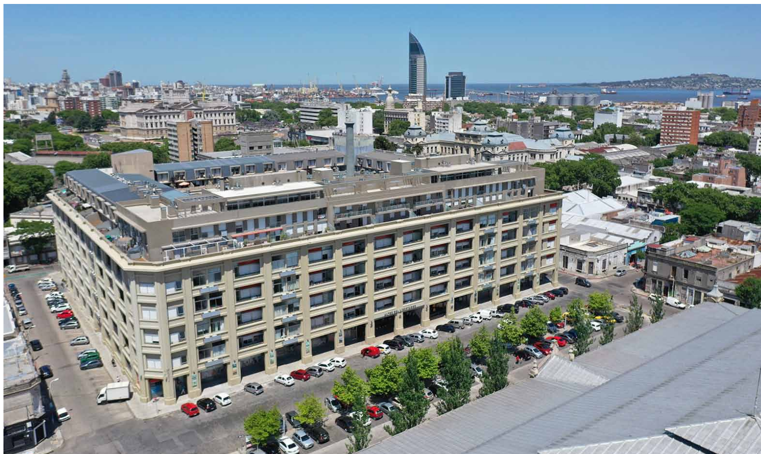
Altos del Libertador - Primer proyecto inmobiliario en asociación público-privado

A ltius Group comenzó sus operaciones en Uruguay en el año 2008 y luego se expandió a Panamá, México y Paraguay. Desde entonces, se instaló como una empresa orientada al desarrollo de proyectos innovadores y rápidamente conquistó el liderazgo del mercado. Cuenta con 5 oficinas de venta, incluyendo dos megashowroom: uno en World Trade Center y otro en la Parada 22 de Av. Roosevelt en Punta del Este. Fueron pioneros con el desarrollo de Altos del Libertador, el primer proyecto de desarrollo inmobiliario de asociación público-privado impulsado por la Agencia Nacional de Vivienda, que cambió la calidad de vida de 377 familias en uno de los barrios con más historia de Montevideo. Actualmente Altius Group cuenta con más de 25 proyectos terminados y más de 2300 apartamentos entregados en Montevideo y Punta del Este. Apartamentos monoambientes, 1, 2, 3 y 4 dormitorios (con la novedad de tipologías lock-off en proyectos seleccionados), con entrega inmediata, en obra y en pre-lanzamiento. ●