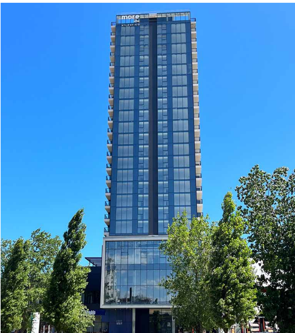
Torre More Atlántico