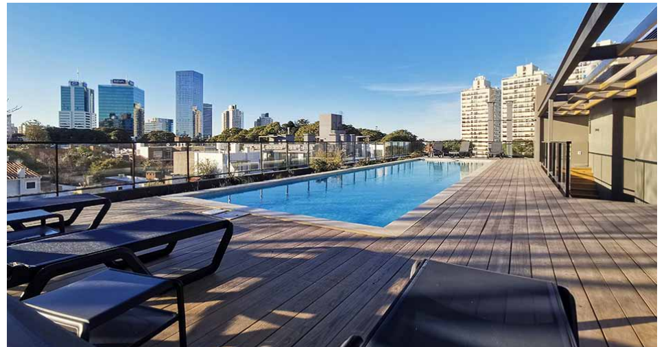
Piscina More Echevarriarza