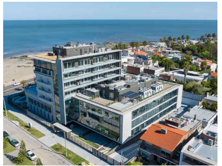
Oficinas Smart Riviera