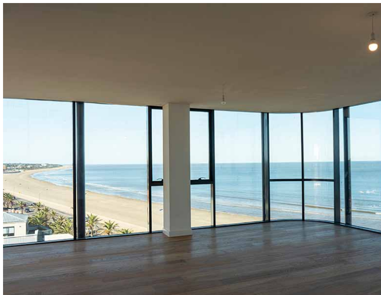
Vista Pent House Bilú Riviera