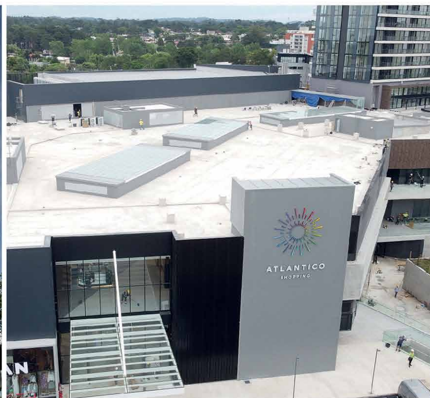
> CENTRO COMERCIAL ATLÁNTICO Área a construir: 48.000 m 2 . Período de ejecución: noviembre 2022 a diciembre 2023.