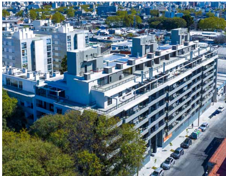
Nostrum Plaza 2