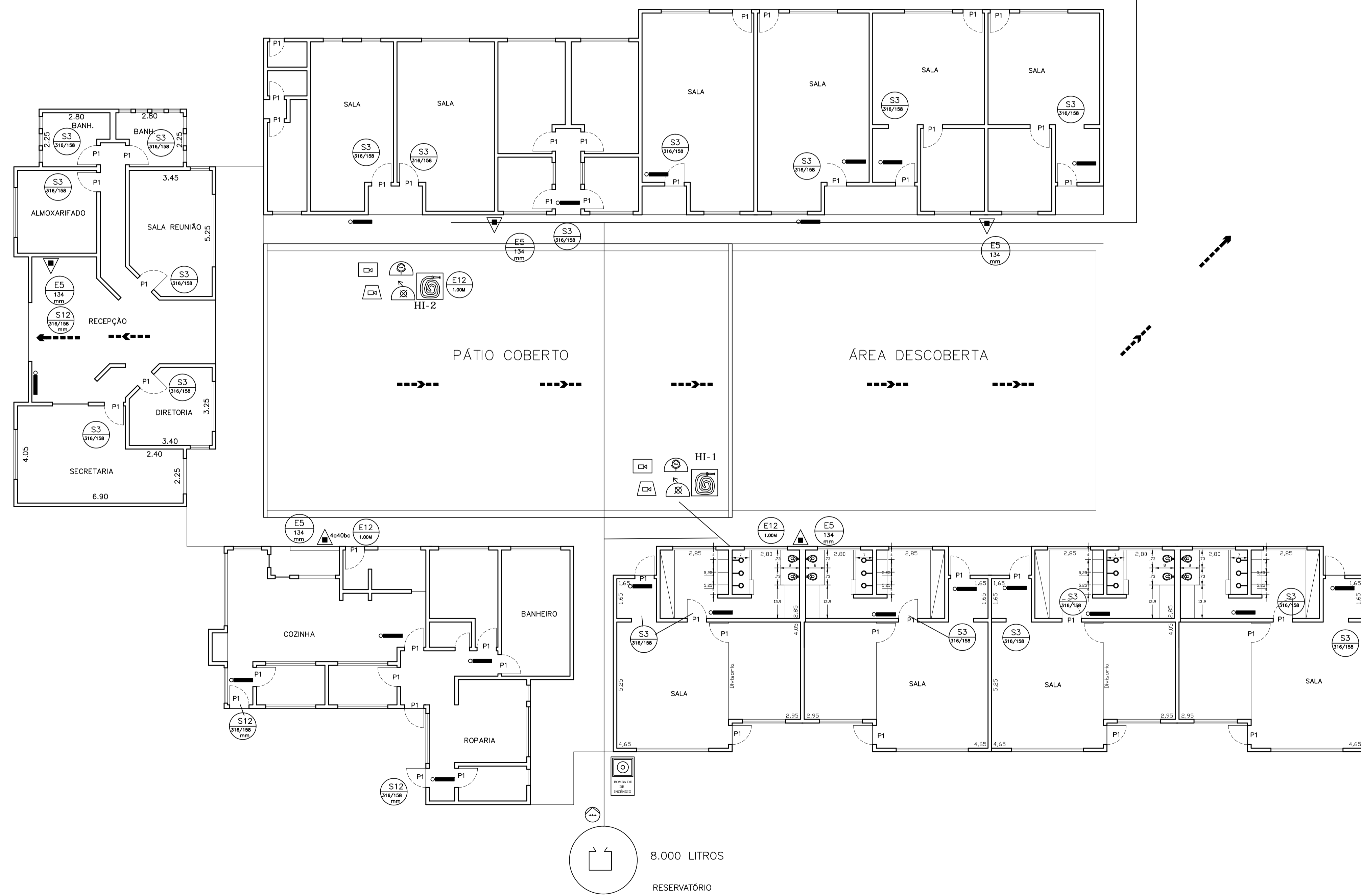
Modelo de sinalização M1 FIGURA 01

Esta edificação está dotada dos seguintes Sistemas de Proteção Contra Incêndio: - Extintores - Iluminação de Emergência - Sinalização de Emergência - Alarma de Incêndio - Hidrantes - Edificação em estrutura de concreto Em caso de emergência: Ligue 193 - Corpo de Bombeiros Ligue 190 - Polícia Militar