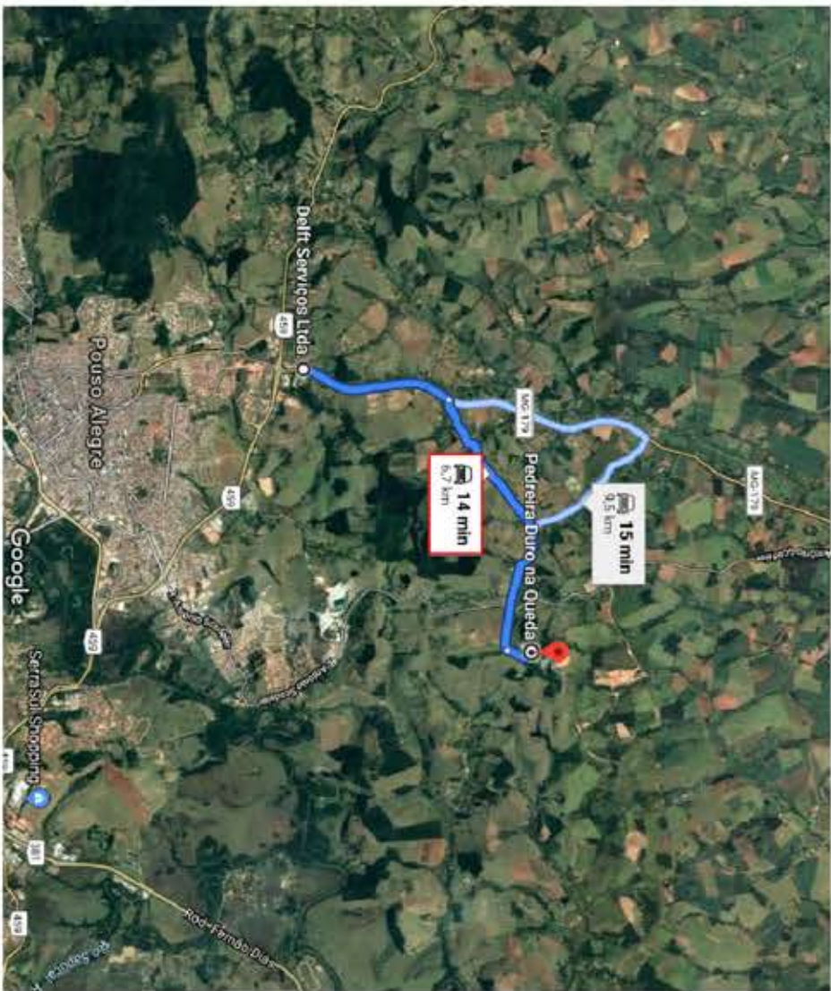
CROQUI DE LOCALIZAÇÃO DE DMT - JAZIDA DE BRITA/AREIA ATÉ A USINA SEM ESCALA