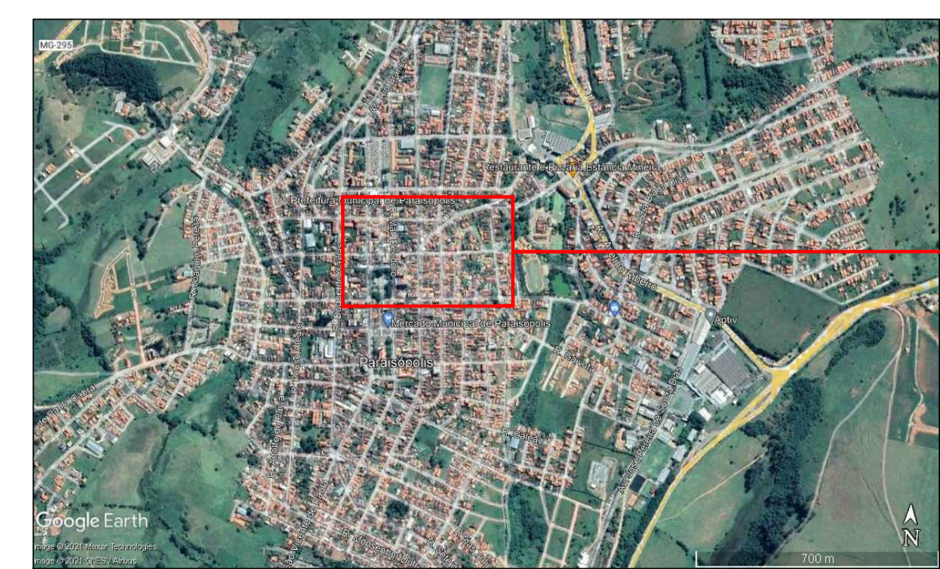
CROQUI DE LOCALIZAÇÃO DA OBRA SEM ESCALA