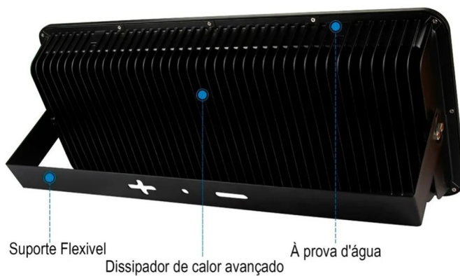
Imagem 2 – Detalhes