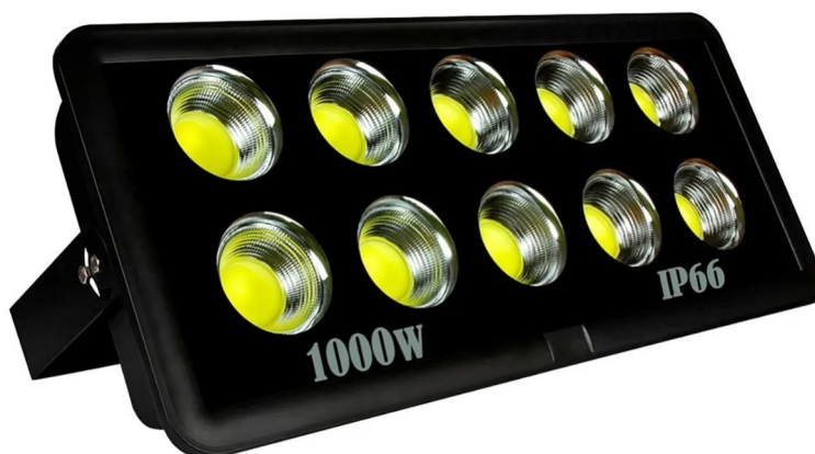
Imagem 3 - Frente