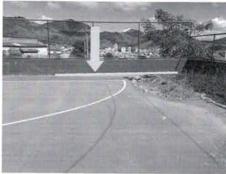
Foto 3 – Inclinação do piso no sentido do limite com o muro indicando a movimentação horizontal e inclinação vertical do mesmo.