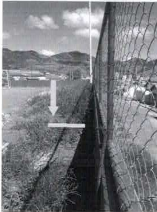
Foto 2 – Fresta entre a borda superior do muro e o limite da quadra ocasionada pelo deslocamento do muro.

A movimentação do muro em decorrência da sua falta de resistência a carga para o qual foi projetado provocou o recalque do piso da quadra o que pode ser observado pela inclinação de parte do piso da quadra em direção ao muro. (fotos 3 e 4)