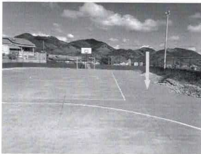
Foto 4 – Inclinação do piso na porção junto a borda superior do muro.

Além disso, as rachaduras a 45° nas laterais do muro demonstram seu movimento no sentido horizontal (arrastamento). Foto 5 e 6.